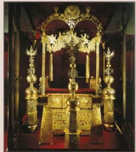
Двойной царский трон