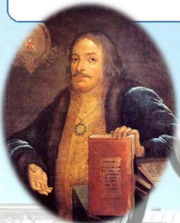
Василий Васильевич Голицын (1643—1714)