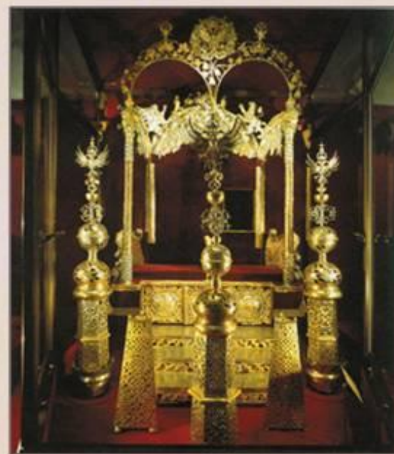
Двойной царский трон