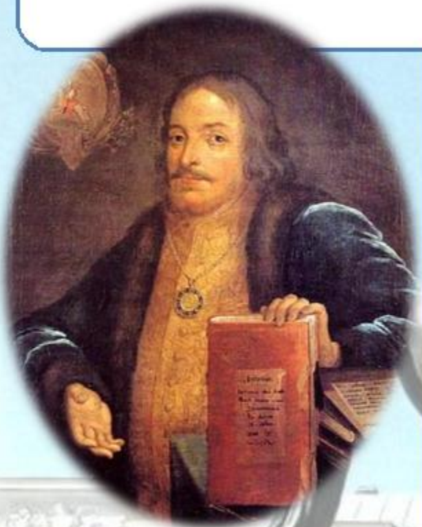
Василий Васильевич Голицын (1643—1714)