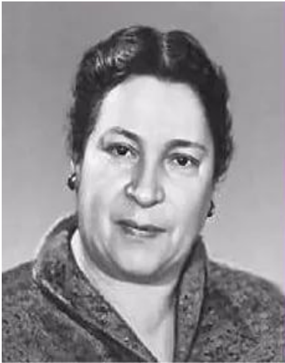
Агния Львовна Барто (1906 – 1981)