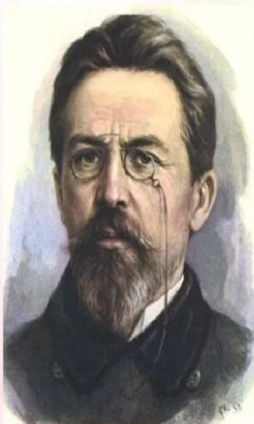
Антон Павлович Чехов