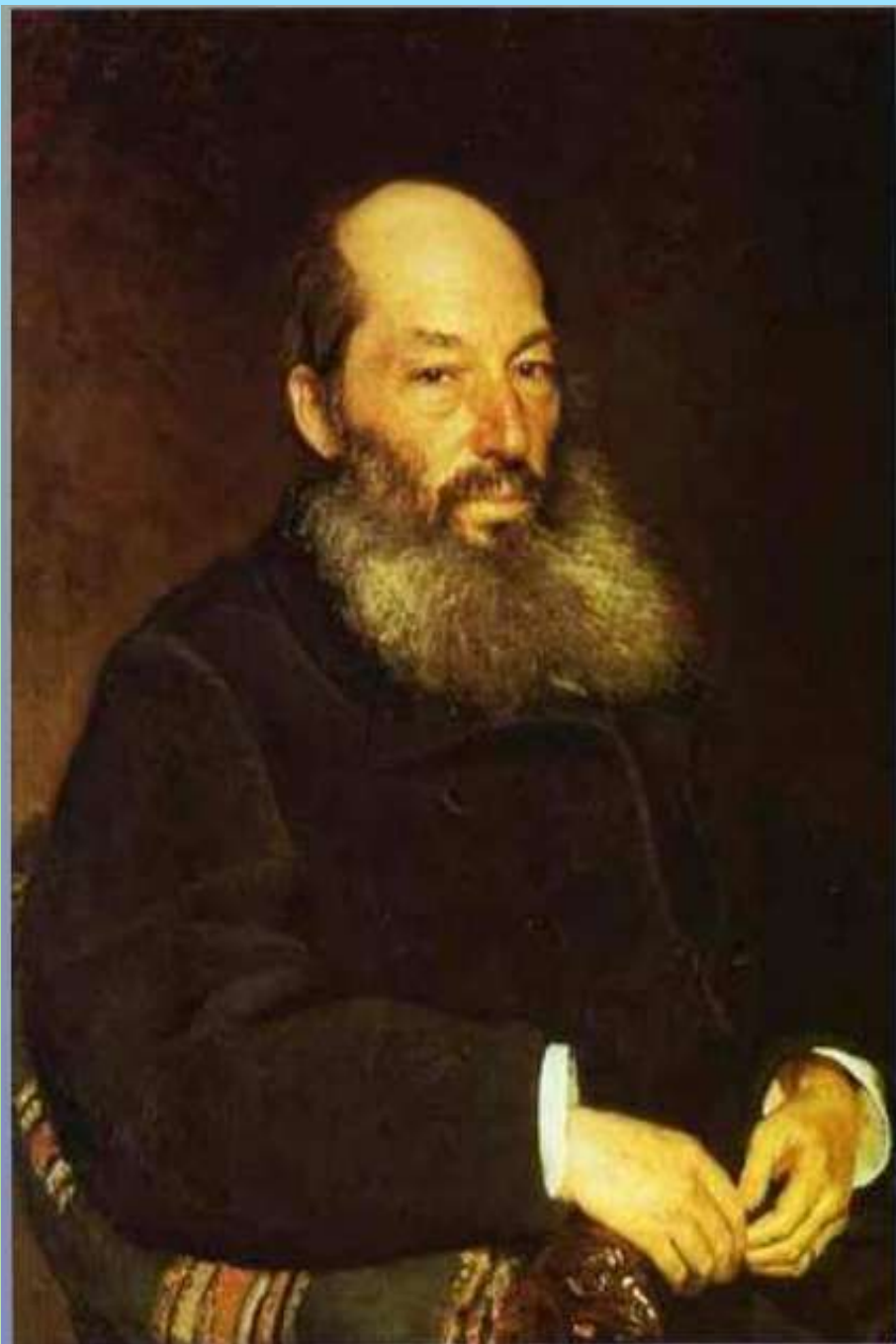
Афанасий Афанасьевич Фет (1820 – 1892)