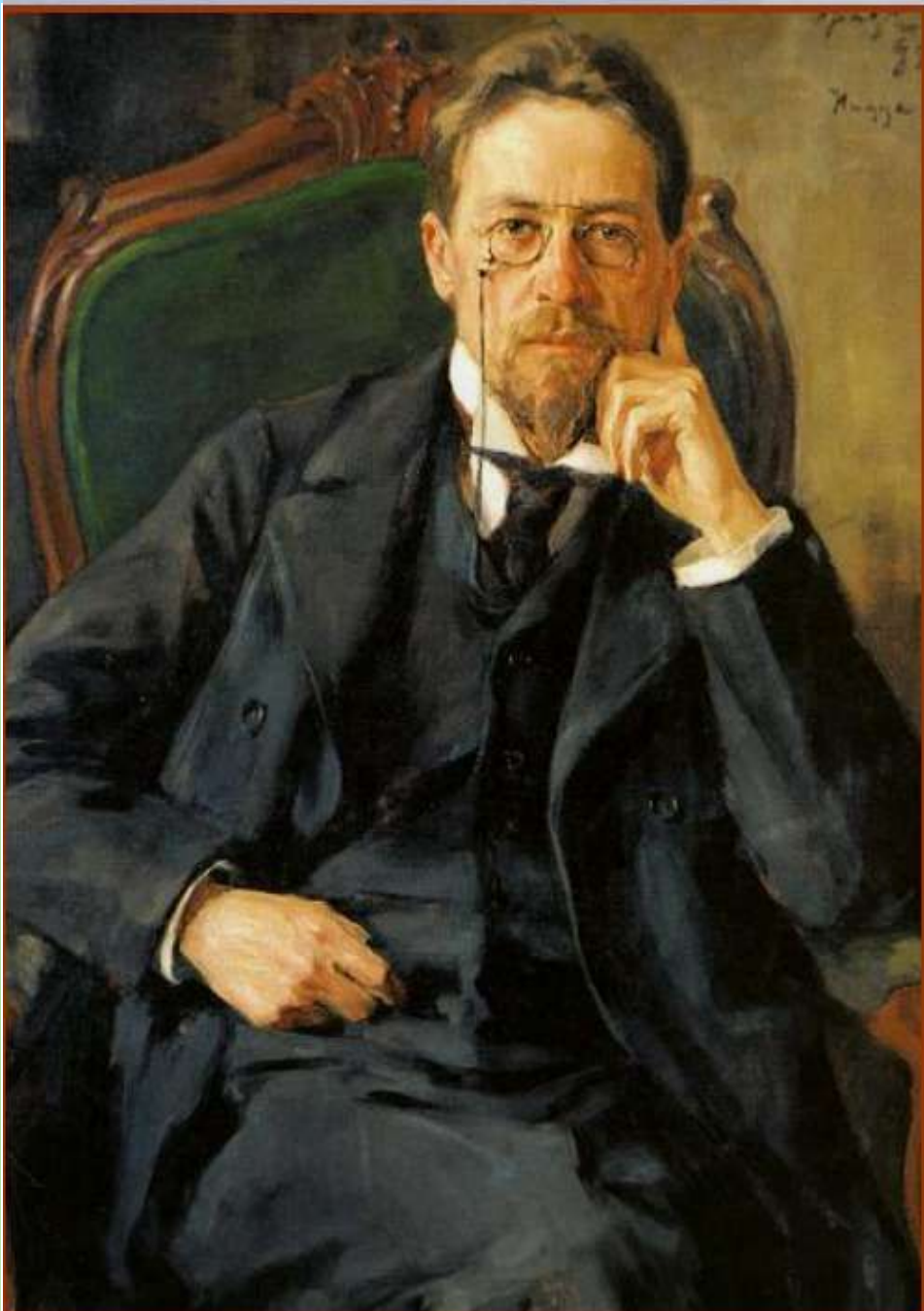
АНТОН Павлович Чехов (1860 – 1904)