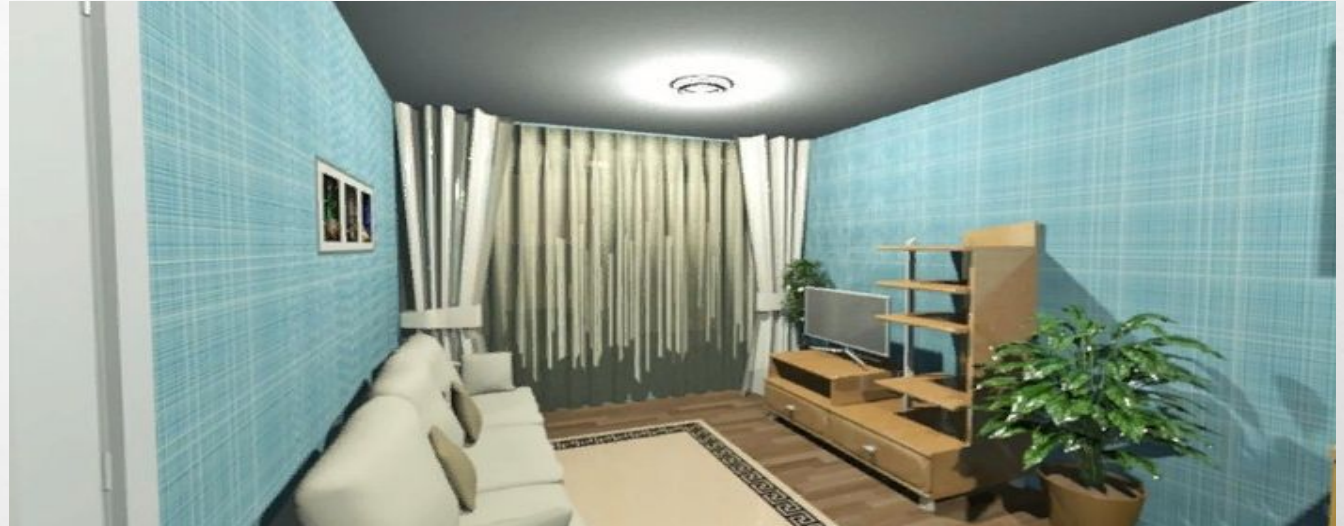
Часть планировки с диваном и телевизором

В самом общежитии мы предлагаем создание гостевой комнаты, прачечной комнаты, спортивного зала, комнаты для отдыха и комнаты для самоподготовки.