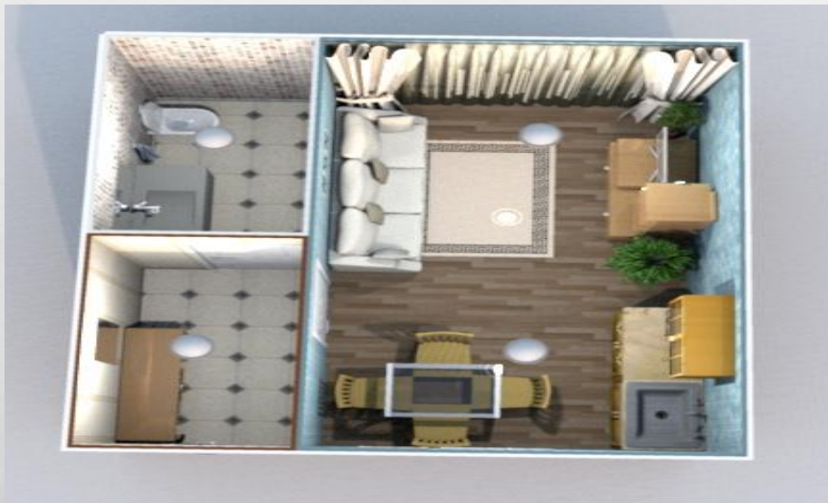
Полная планировка гостевой комнаты

Гостевая комната по планировке будет очень похожа на комнаты для проживания. Сама комната подразумевает наличие диванов и телевизора для комфортного времяпровождения. Также необходим обеденный стол и небольшой кухонный гарнитур с раковиной, чтобы с гостями можно было бы быстро перекусить.