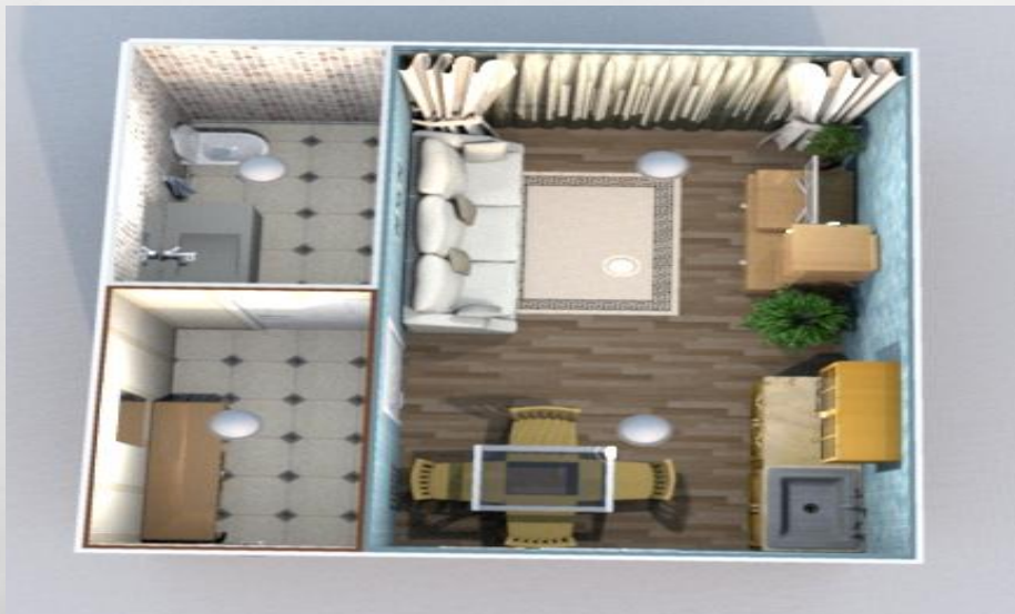
Полная планировка гостевой комнаты

Гостевая комната по планировке будет очень похожа на комнаты для проживания. Сама комната подразумевает наличие диванов и телевизора для комфортного времяпровождения. Также необходим обеденный стол и небольшой кухонный гарнитур с раковиной, чтобы с гостями можно было бы быстро перекусить.