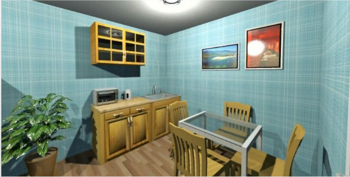
Часть планировки с обеденной зоной