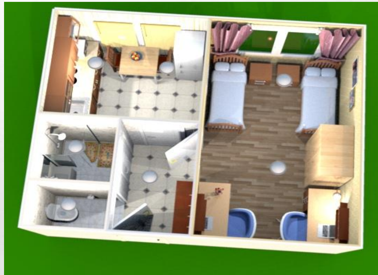
Полная планировка блока

В макете блок рассчитан для проживания двух студентов, по нашему мнению, – это самый комфортный вариант проживания. Соответственно, в комнате должны находиться кровати, прикроватные комоды, вместительный шкаф для вещей с полками и отсеками для вешалок. Также столы и стулья для подготовки к занятиям.