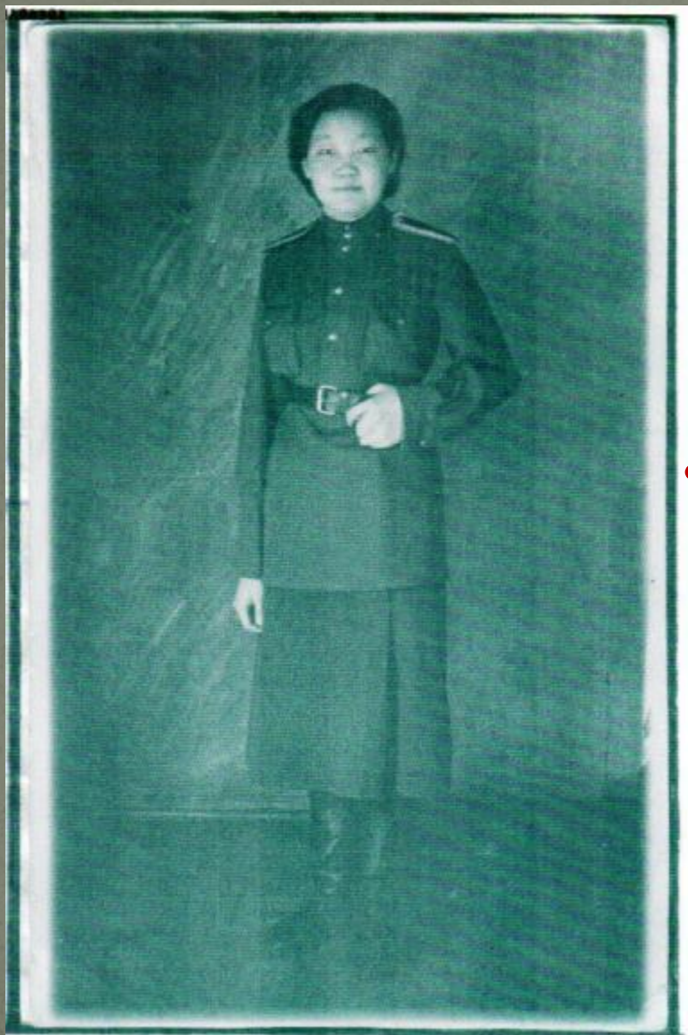
25 февраля 1943 года г.Москва