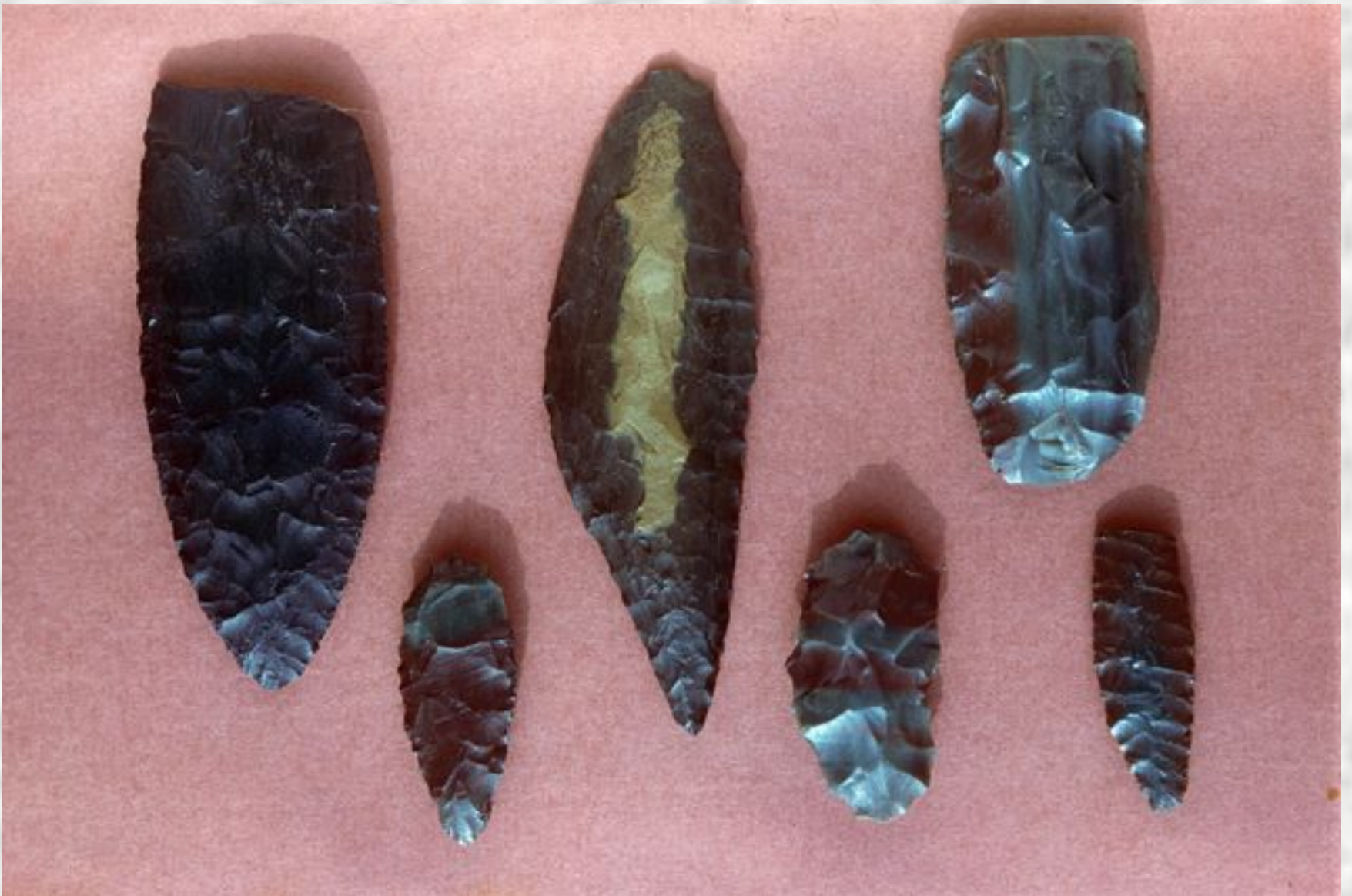
Древнейшие орудия труда