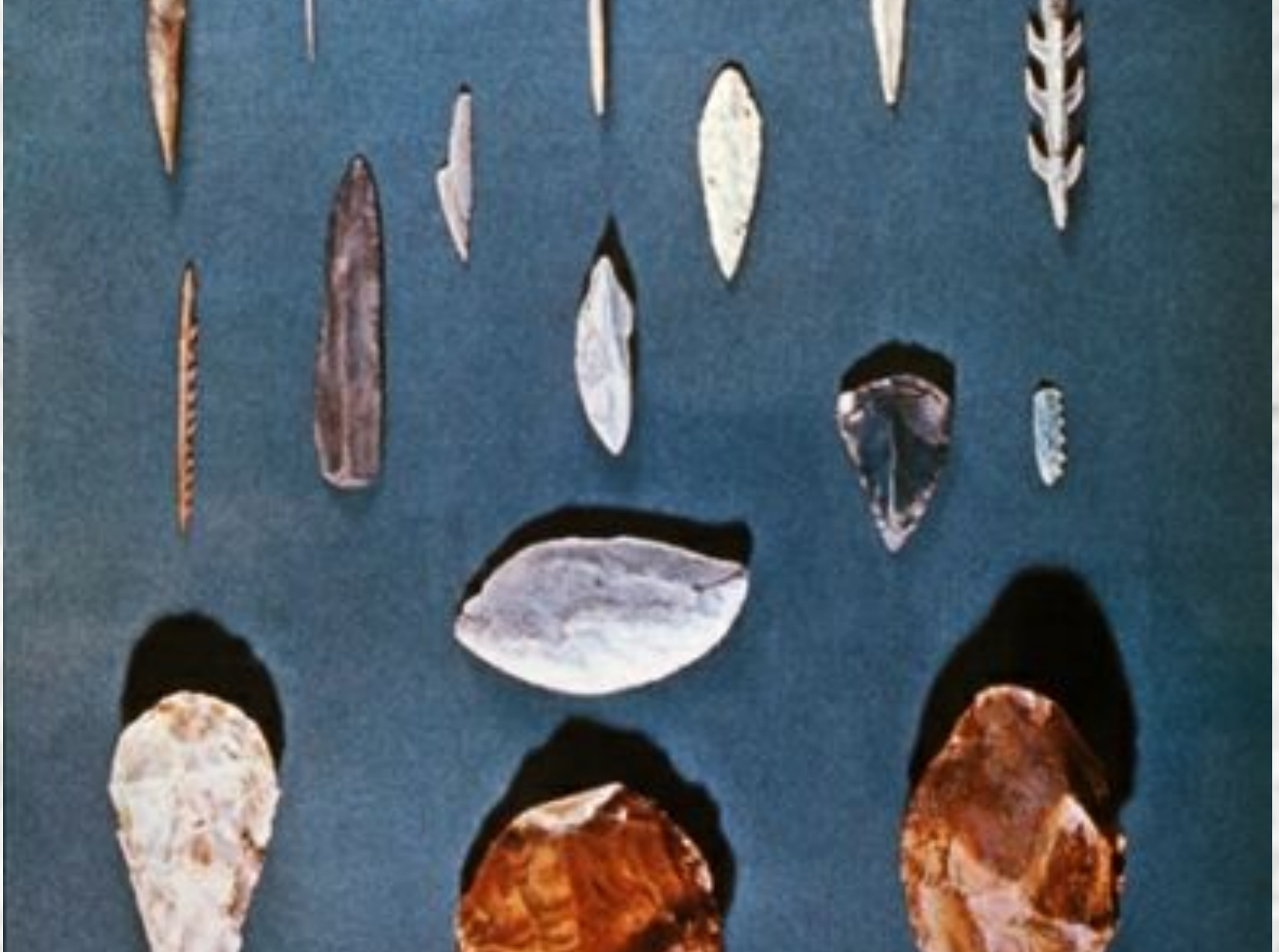
Древнейшие орудия труда