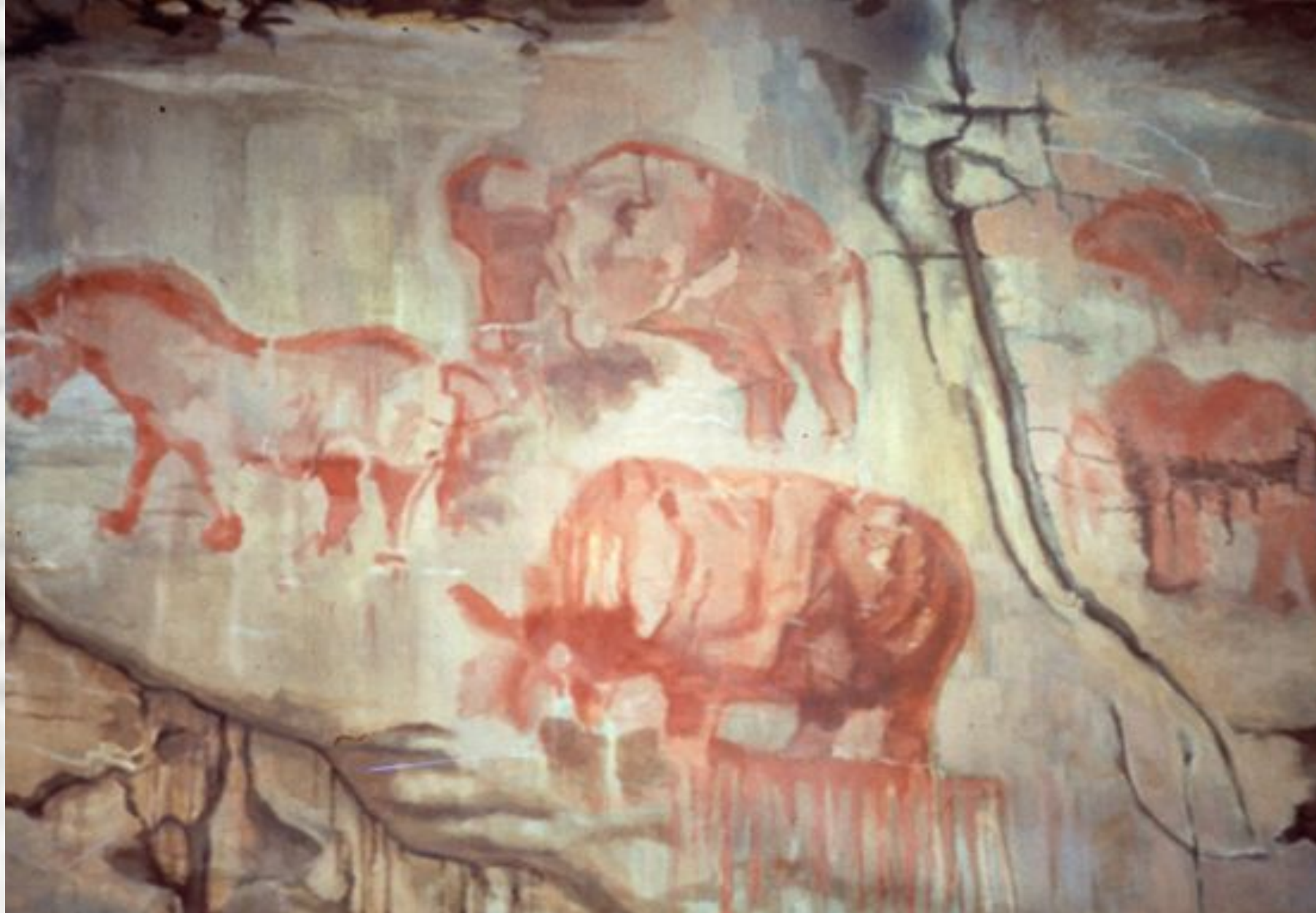
Капова пещера, южный Урал. 13 – 12 тыс. лет назад