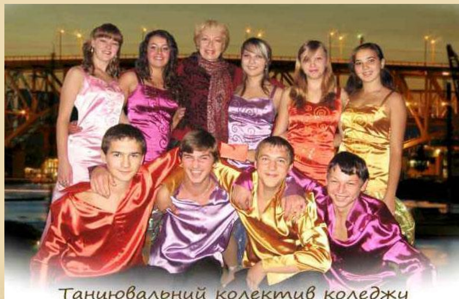
Танцювальний колектив коледжу