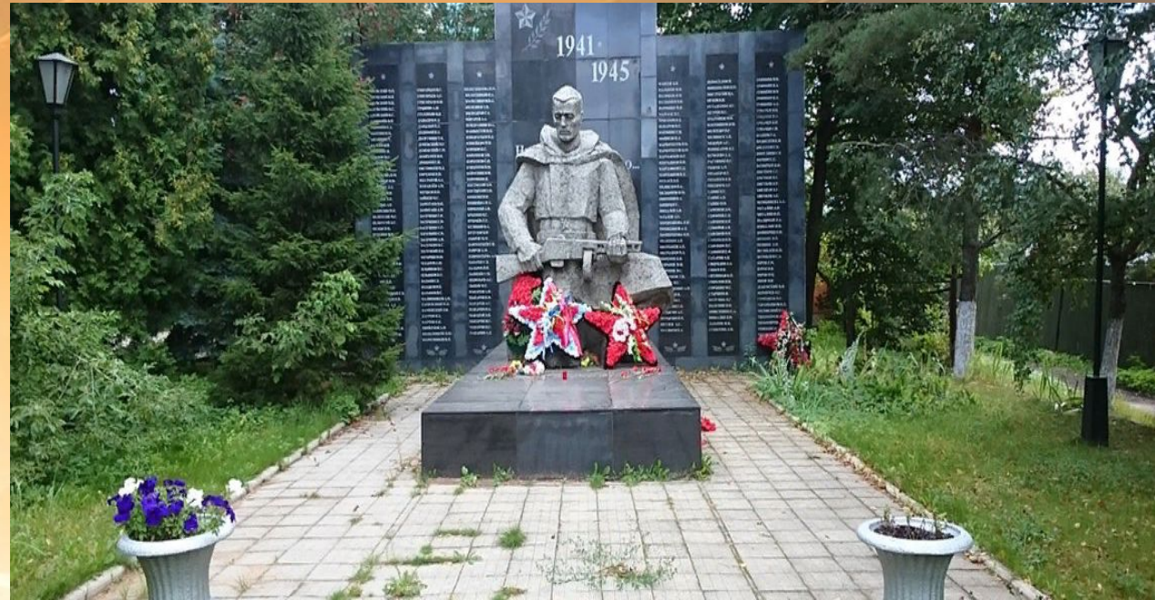
Мемориал Неизвестный солдат в Пушкино

Только одна Великая Отечественная война поглотила в своем пламени 5 миллионов человек, даже не спросив напоследок, как их зовут. Но пропасть без вести - не значит раствориться во тьме истории. Они живы в памяти людской, которая бережно хранится и передается от поколения к поколению. Настоящий закон - это наш общий земной поклон людям, которые ценой своей жизни спасли Россию.