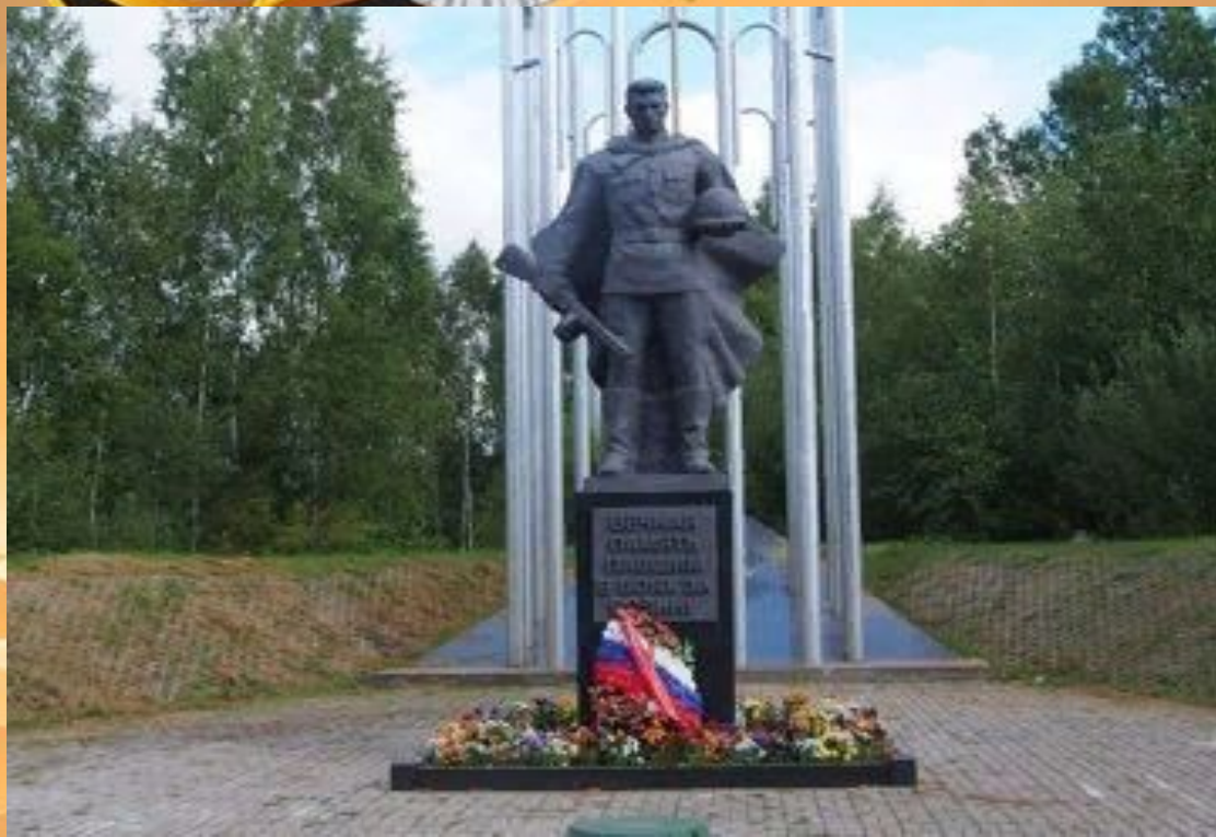
Памятник Неизвестному солдату .Братск