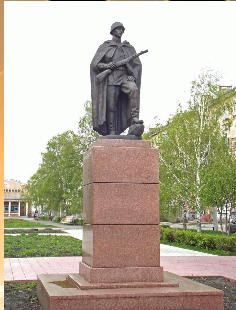
Памятник Неизвестному солдату . Новокузнецк

Имена многих из них до сих пор остаются неизвестными. Но все они - герои своей страны - живы в памяти людской, поэтому важно бережно хранить и передавать от поколения к поколению эту память.