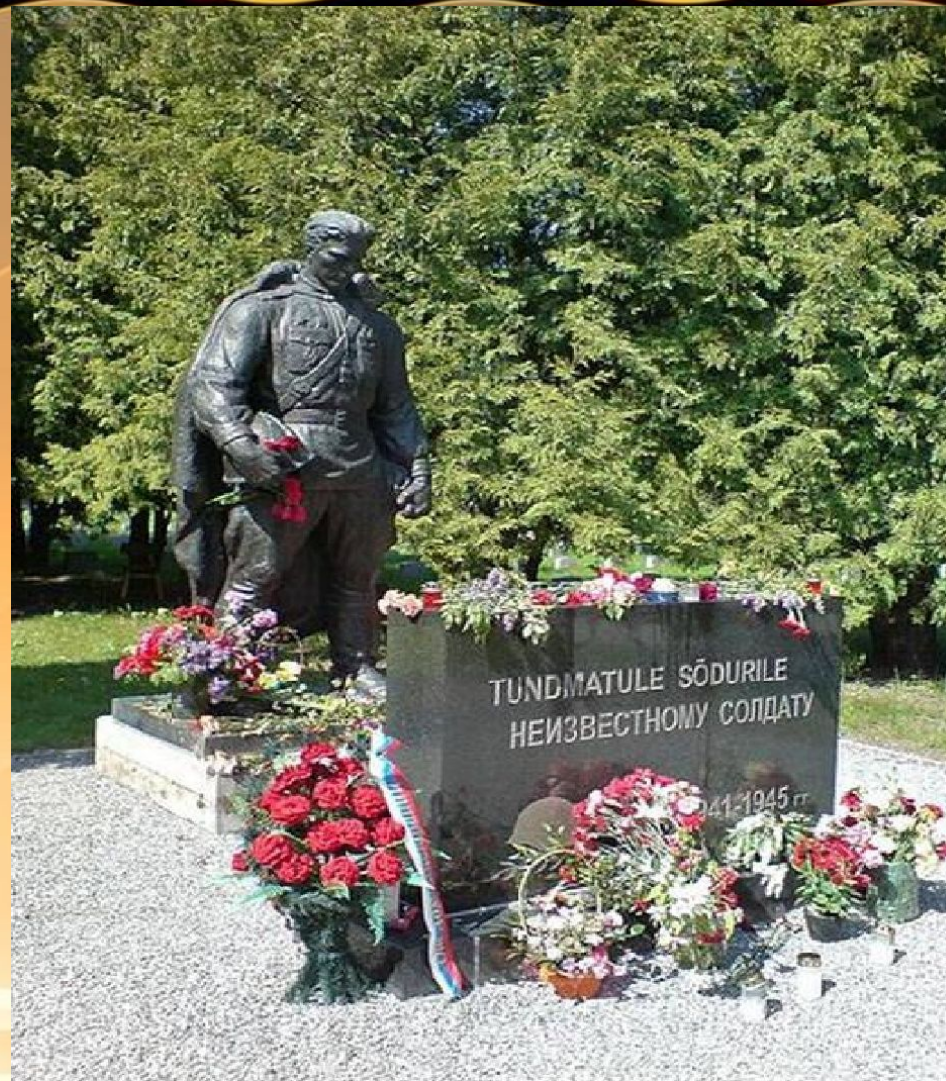
Памятник Неизвестному солдату в Эстонии. 1941-1945 гг.

Имя твое неизвестно, солдат! Был ты отец, или сын, или брат, Звали тебя Иван или Василий. Жизнь ты отдал во спасенье России. Нами твой подвиг, солдат, не забыт – Вечный огонь на могиле горит,