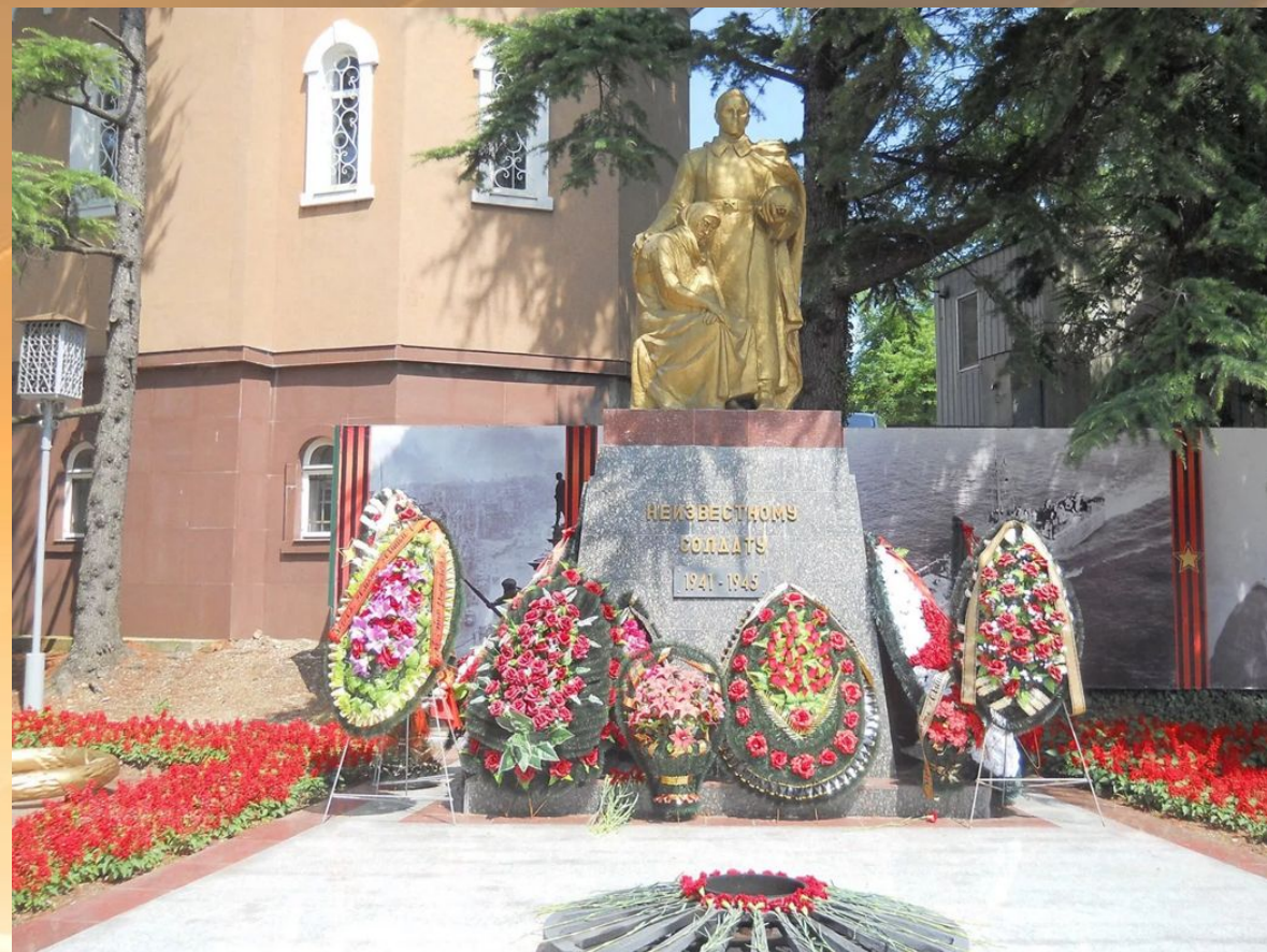
Памятник Неизвестному солдату в Туапсе.