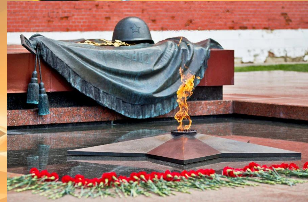
Могила Неизвестного Солдата в Москве.

Трудно было решить, кого именно хоронить у стен Кремля. Выбор пал на останки воина из братской могилы, как раз обнаруженной в те дни под Москвой. Форма без знаков отличия и с ремнём подтверждала, что солдат не был дезертиром. Пленным боец тоже не мог быть, так как до этого места немцы не дошли. Документов при солдате найдено не было, а значит прах его был действительно «неизвестным».