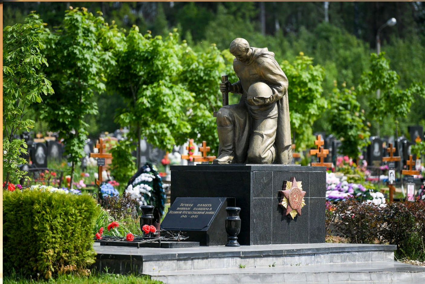
Памятник Неизвестному солдату в Краснознаменске

Звезды салюта в небо летят, Помним тебя, Неизвестный Солдат! Он не сдал автомат и пилотку свою. Неизвестный солдат пал в жестоком бою. Неизвестный солдат, чей-то сын или брат, Он с войны никогда не вернётся назад.