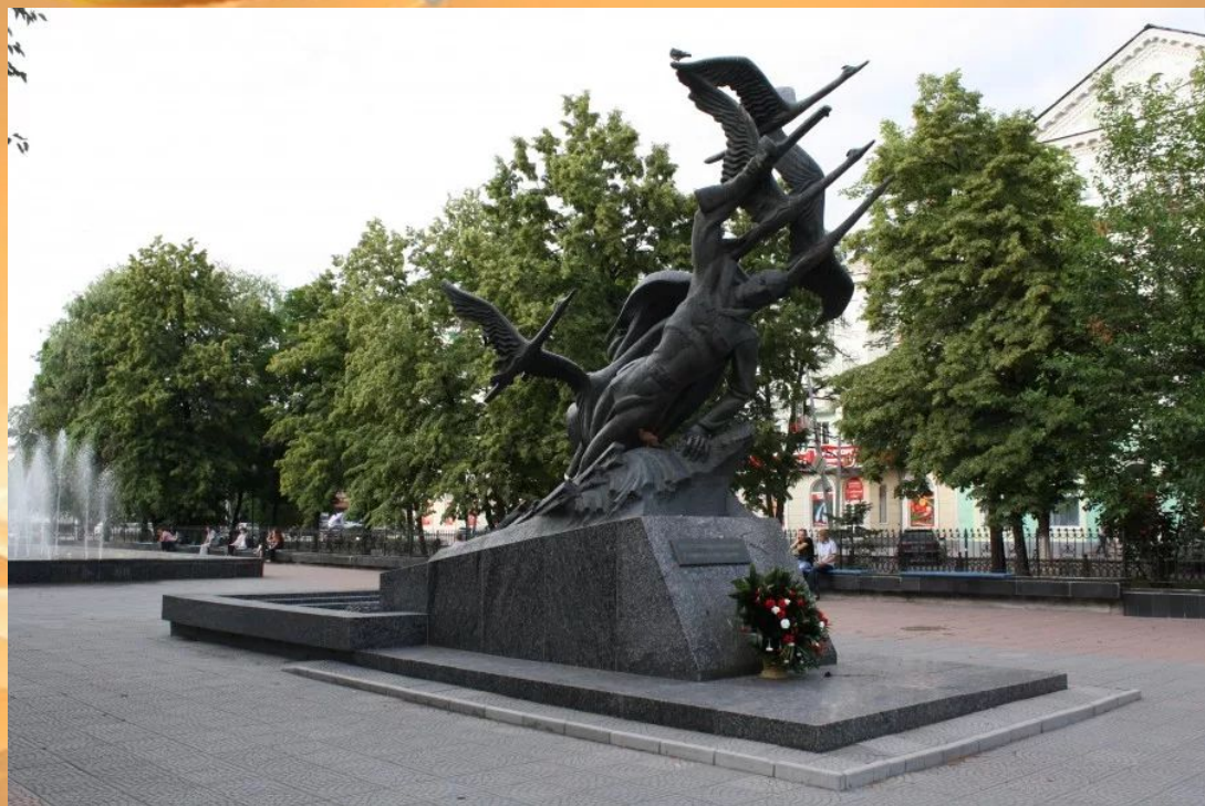
Памятник "Журавли" (могила Неизвестного солдата) Луганс