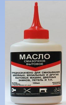
машинно е масло