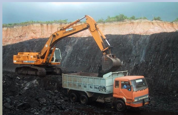
открытый способ добычи