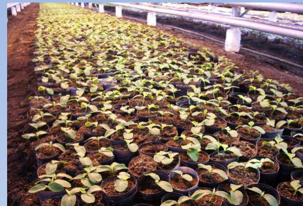
почва для рассады