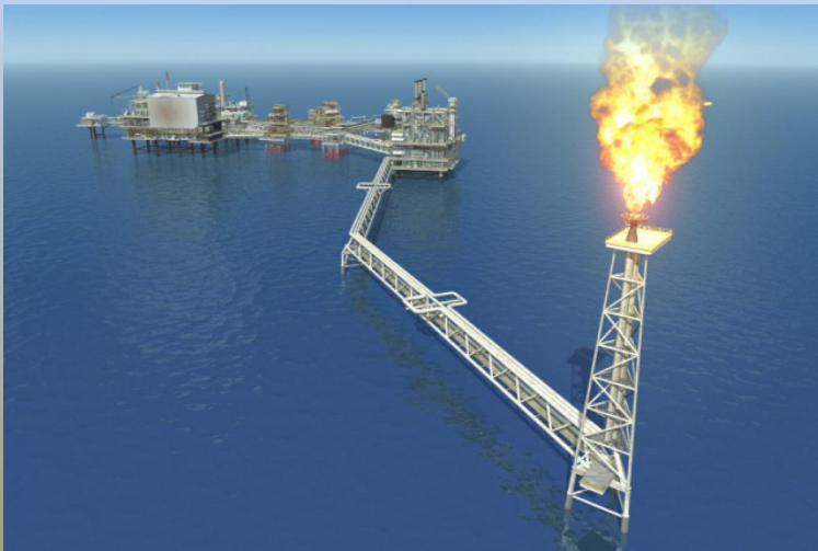
добыча природного газа