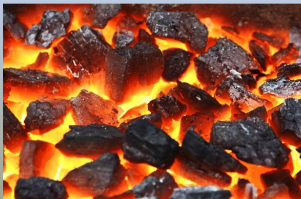
уголь хорошо горит