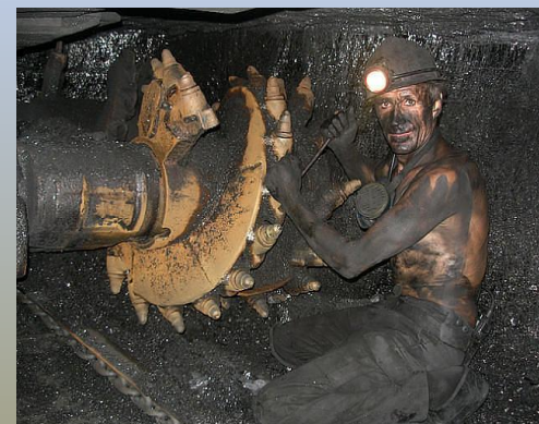
закрытый способ добычи (шахта)