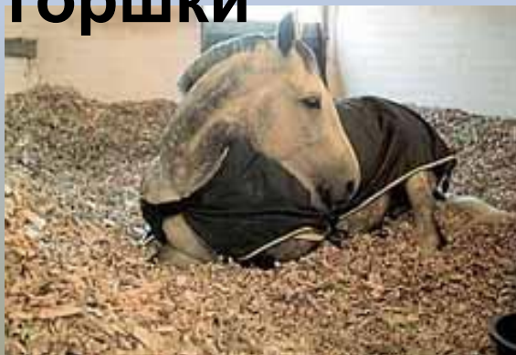
подстилка для животных