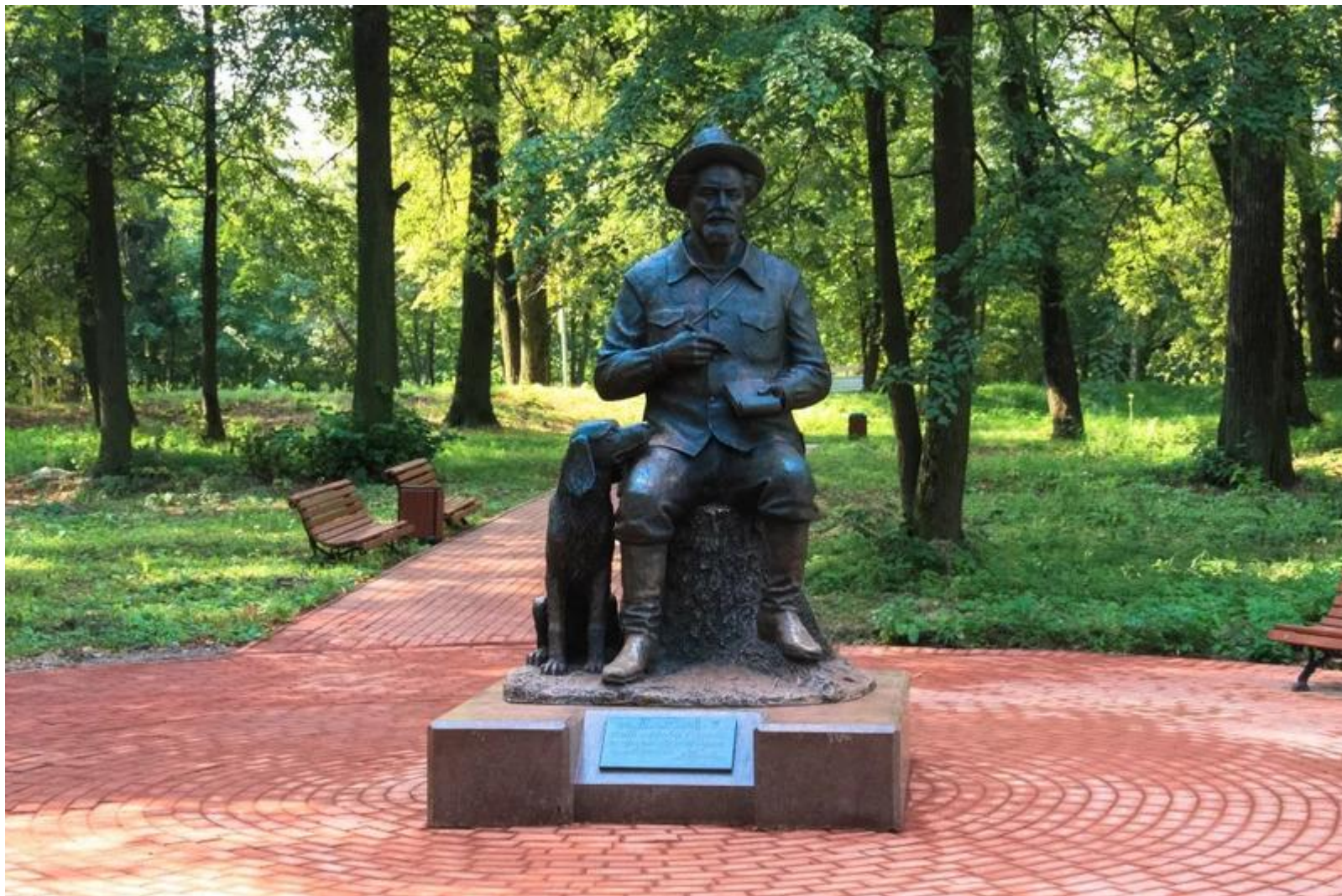
Бронзовый памятник в г. Сергиев Посад.