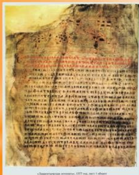
«Законная грамота», 1577 год, лист 1 оборот

В России одно из первых сведений об аптеках относится к 1553 г. В Никоновской летописи упоминается «Матюшка-аптекарь».