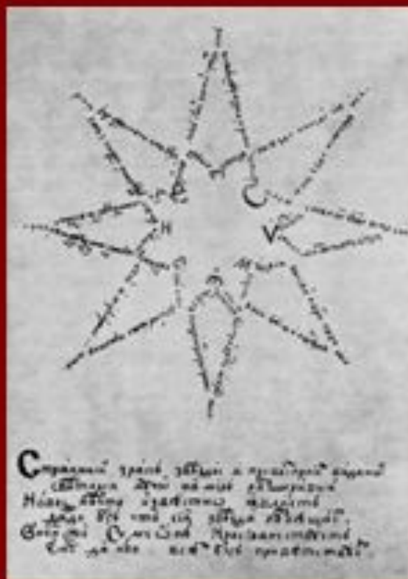
Стихи Симеона Полоцкого написанные в форме звезды