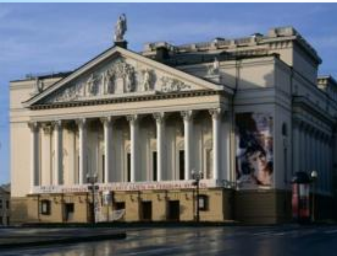
Большой оперный театр