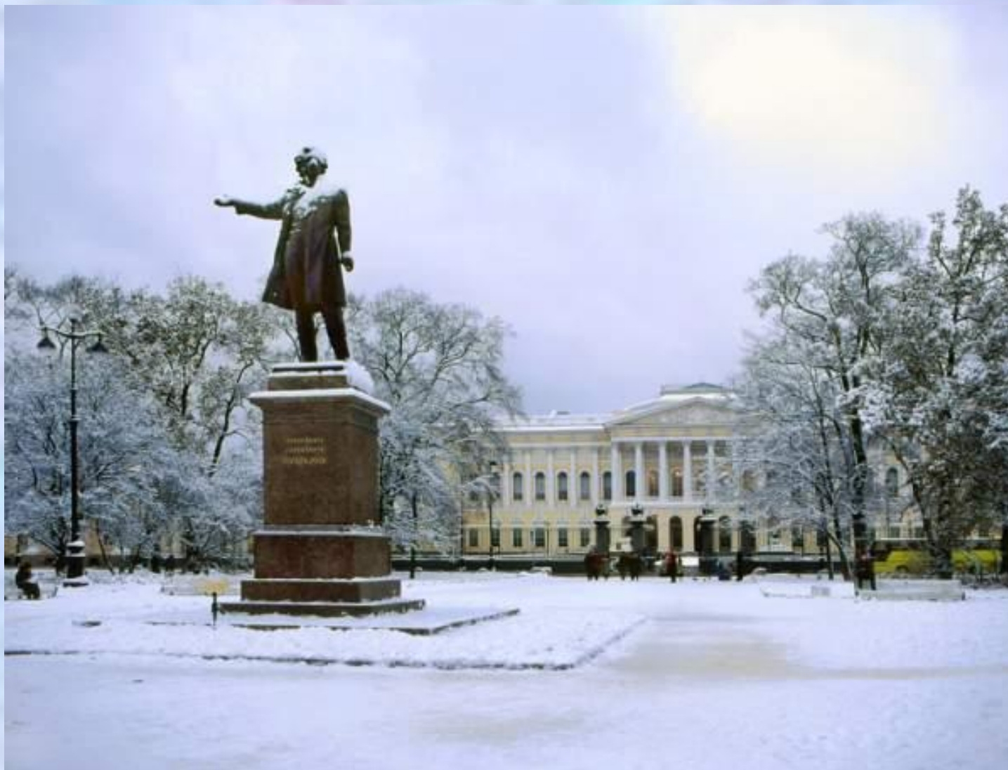
Памятник А.С. Пушкину на Площади Искусств