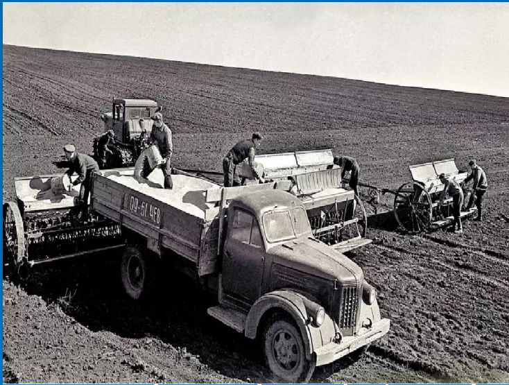
способствовало росту автор

уботниках по восстановлению предприятий, ти, образовавшиеся во время Гражданской