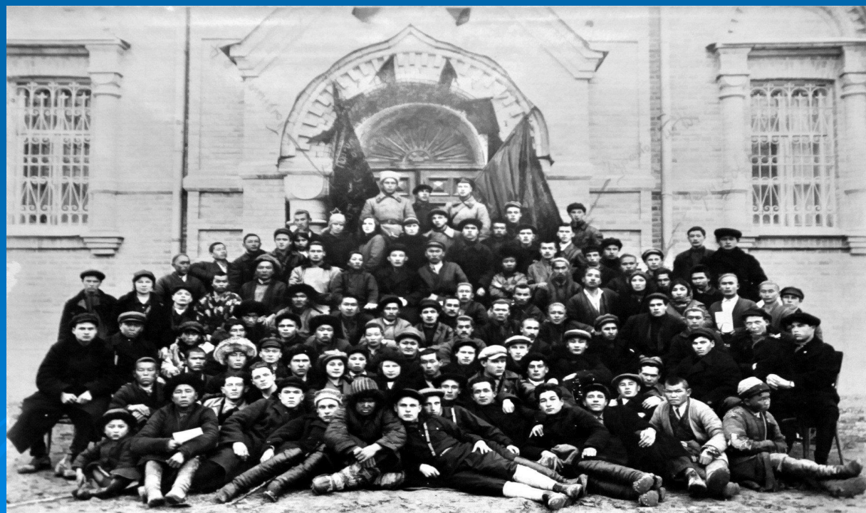
Делегаты 1-го съезда РКСМ.

В разгар Гражданской войны (1918 год) в Москве состоялся первый съезд делегатов от разрозненных молодёжных организаций по всей стране. 176 человек прибыли отовсюду: с территорий, захваченных белогвардейцами, а также немецкой армией (Украина, Польша); из отделившейся Финляндии и самопровозглашённых Прибалтийских республик, а также из оккупированного Японией Владивостока. Их объединяло желание создавать новую державу, построенную на принципах справедливости. День открытия съезда (29 октября) войдёт в историю как День рождения комсомола, объединившего более 22 тыс. человек. В принятом уставе и программе всероссийской организации говорилось, что она является самостоятельной, но действует под руководством коммунистической партии, что определило её идейную направленность