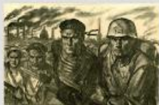
ВСЕ НА ЗАЩИТУ ЛЕНИНГРАДА