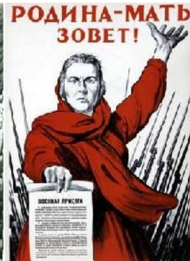
Плакат "Родина-мать зовёт!"