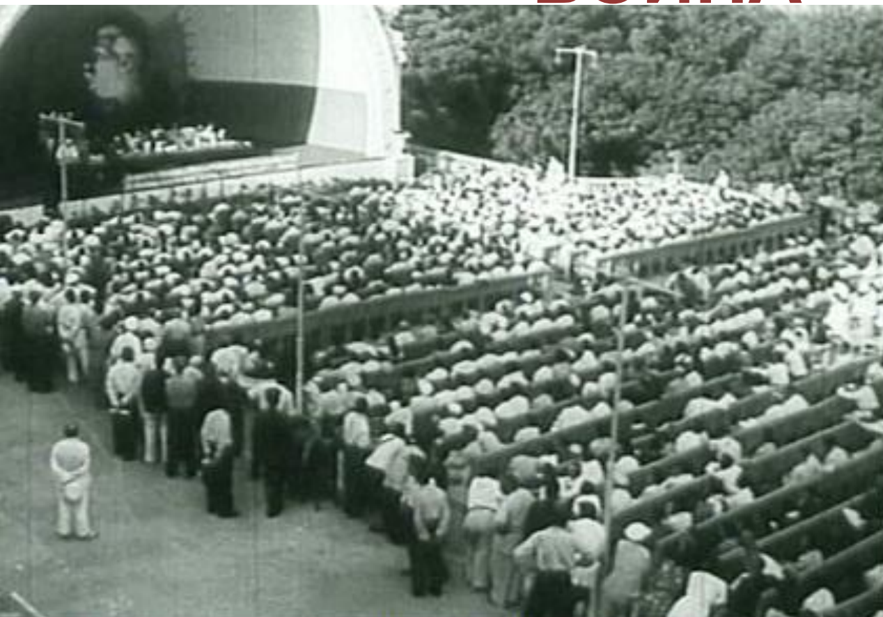
Объявление начала войны. 22 июня 1941 года