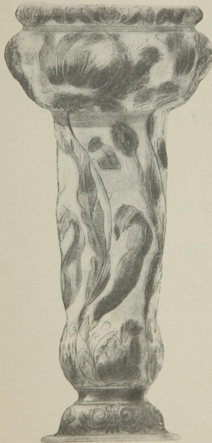
1. Рис. ученицы Рисов. Школы Кругликовой (2-я премiя).

изъ числа представленныхъ на первiй, объявленный Заводами, конкурсъ: