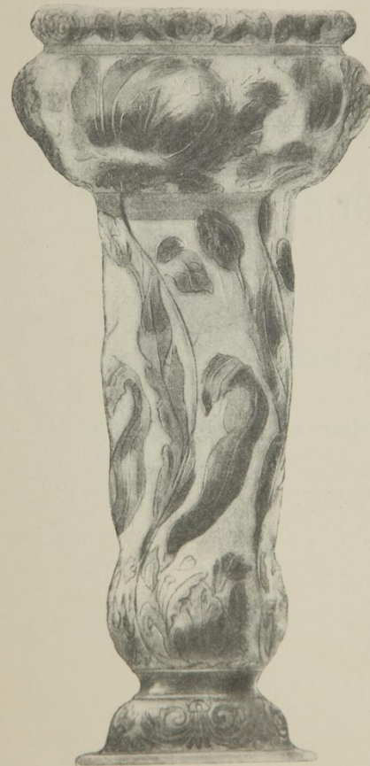
1. Рис. ученицы Рисов. Школы Кругликовой (2-я премія). 1. Dess. de M lle Krouglikoff, élève de l'École de la Société (2-e prix).

изъ числа представленныхъ на первѣй, объявленнѣй Заводами, конкурсѣ: