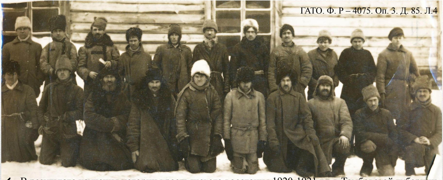
ГАТО. Ф. Р – 4075. Оп. 3. Д. 85. Л.4