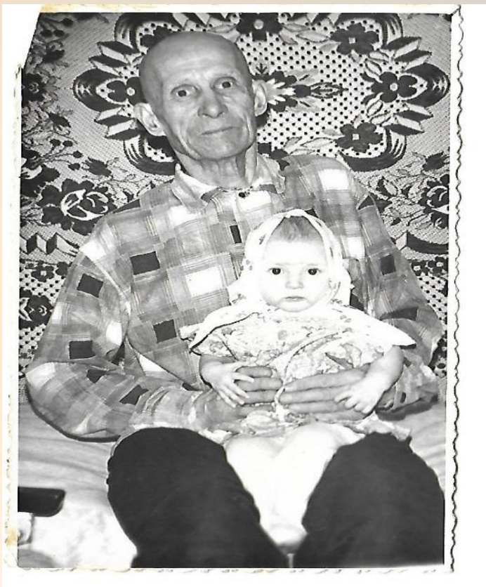
Дедушка со своей внучкой