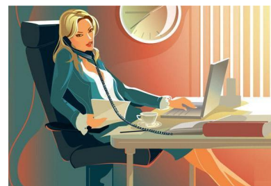
Владелец компании по оказанию бухгалтерских услуг