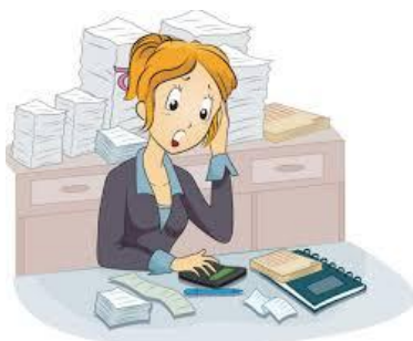
Бухгалтер в корпорации