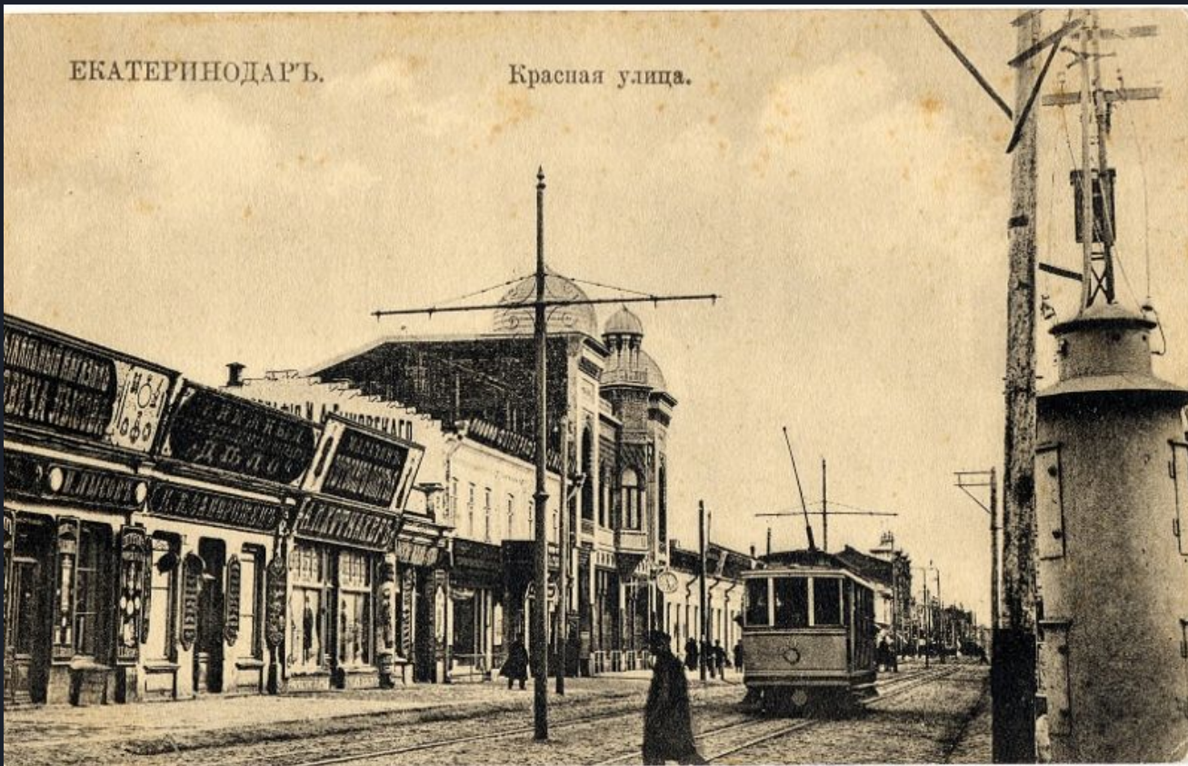
Vor etwas mehr als 200 Jahren war es nicht einmal eine Stadt, sondern eine kleine militärische Festung. Und sie hieß Ekatherinodar - zu Ehren der Königin Ekatherina II.