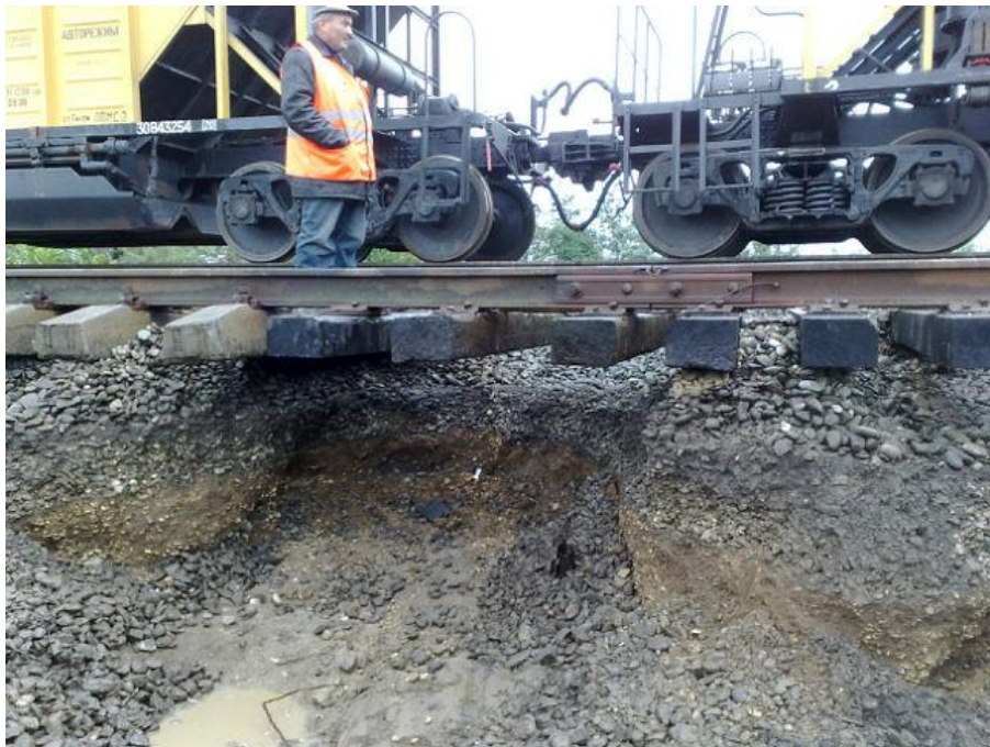
Подмыв земляного полотна