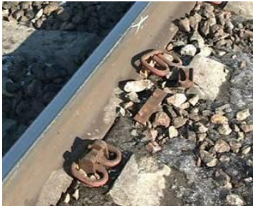
Нарушение крепления рельса к шпале (крепления упорной клеммы)