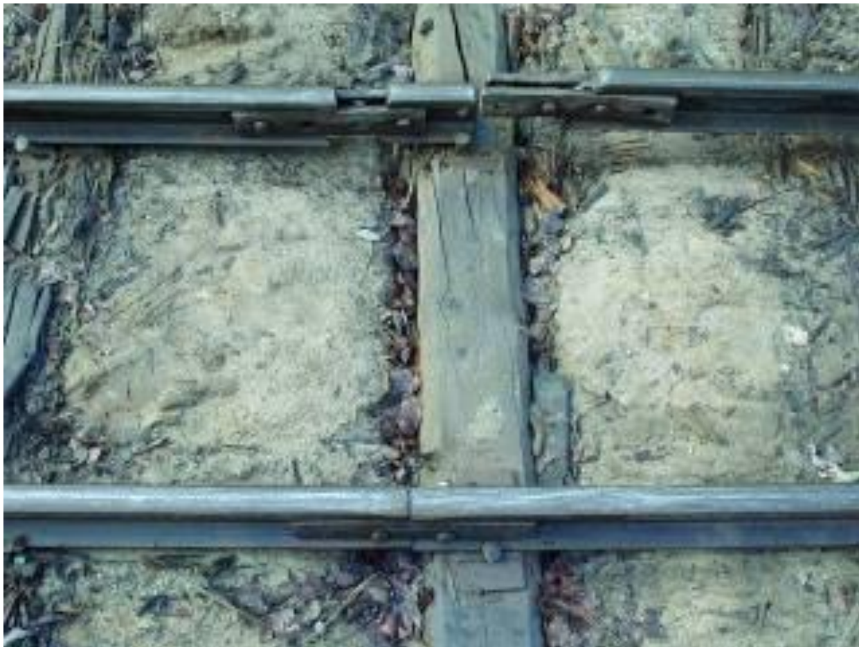
Разрыв стыка соединения рельс