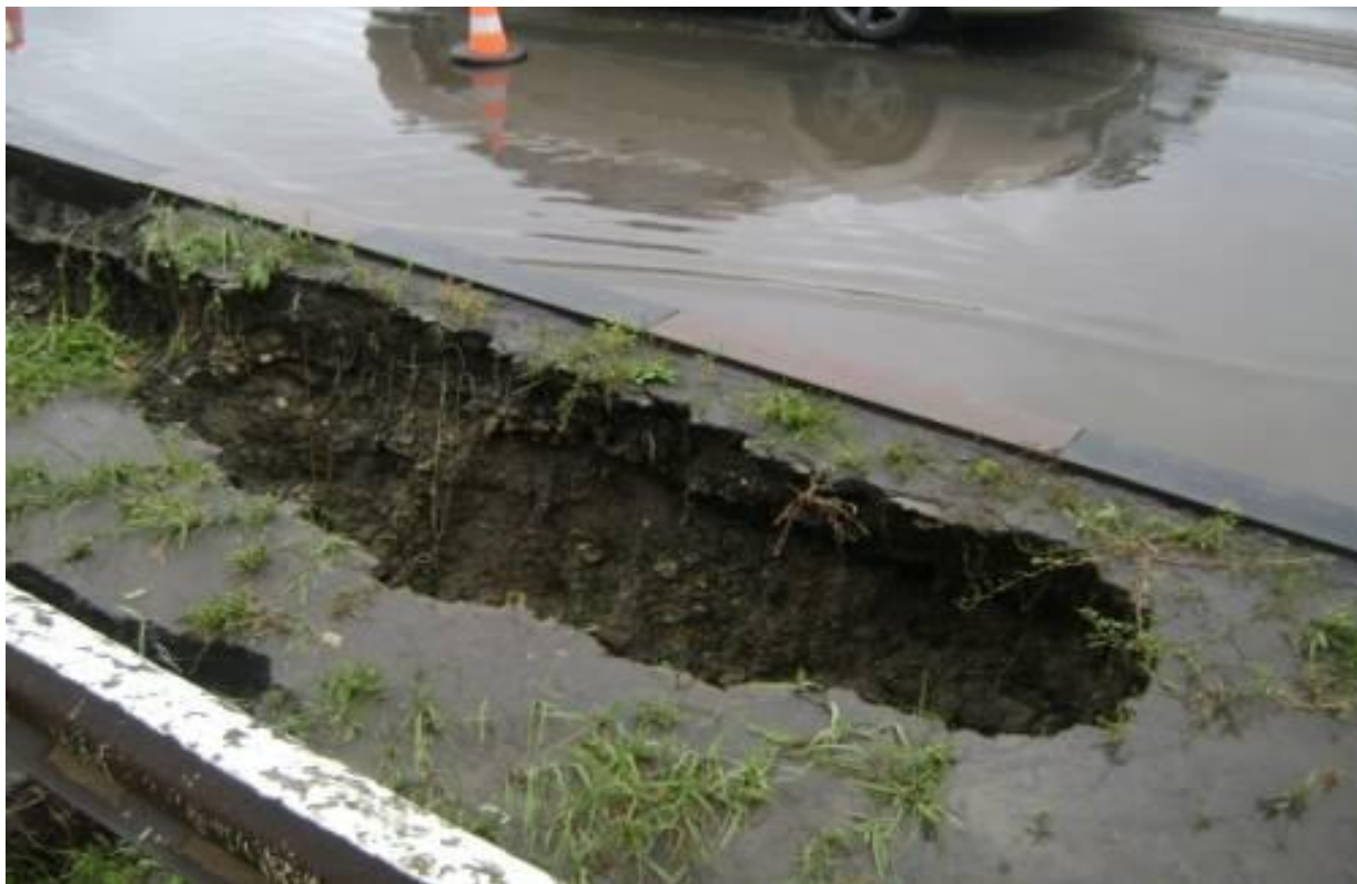
Промоина в балласте