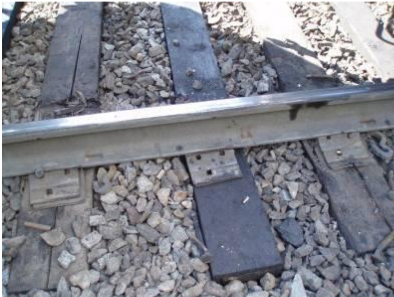
«Расшивка» пути, отсутствие костылей