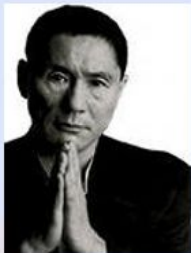
Известный японский писатель и кинорежиссер