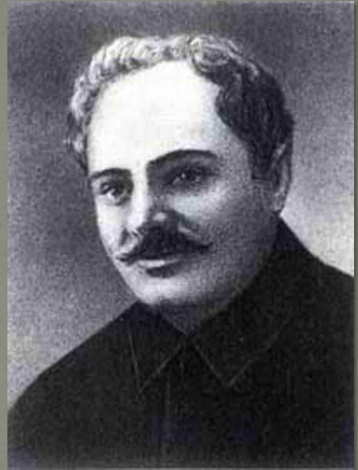
Моисей Львович Рухимович