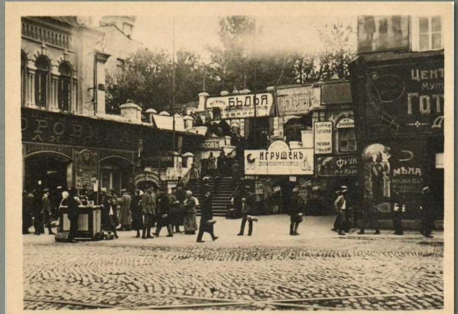
Оккупированный Харьков (1918 г.)