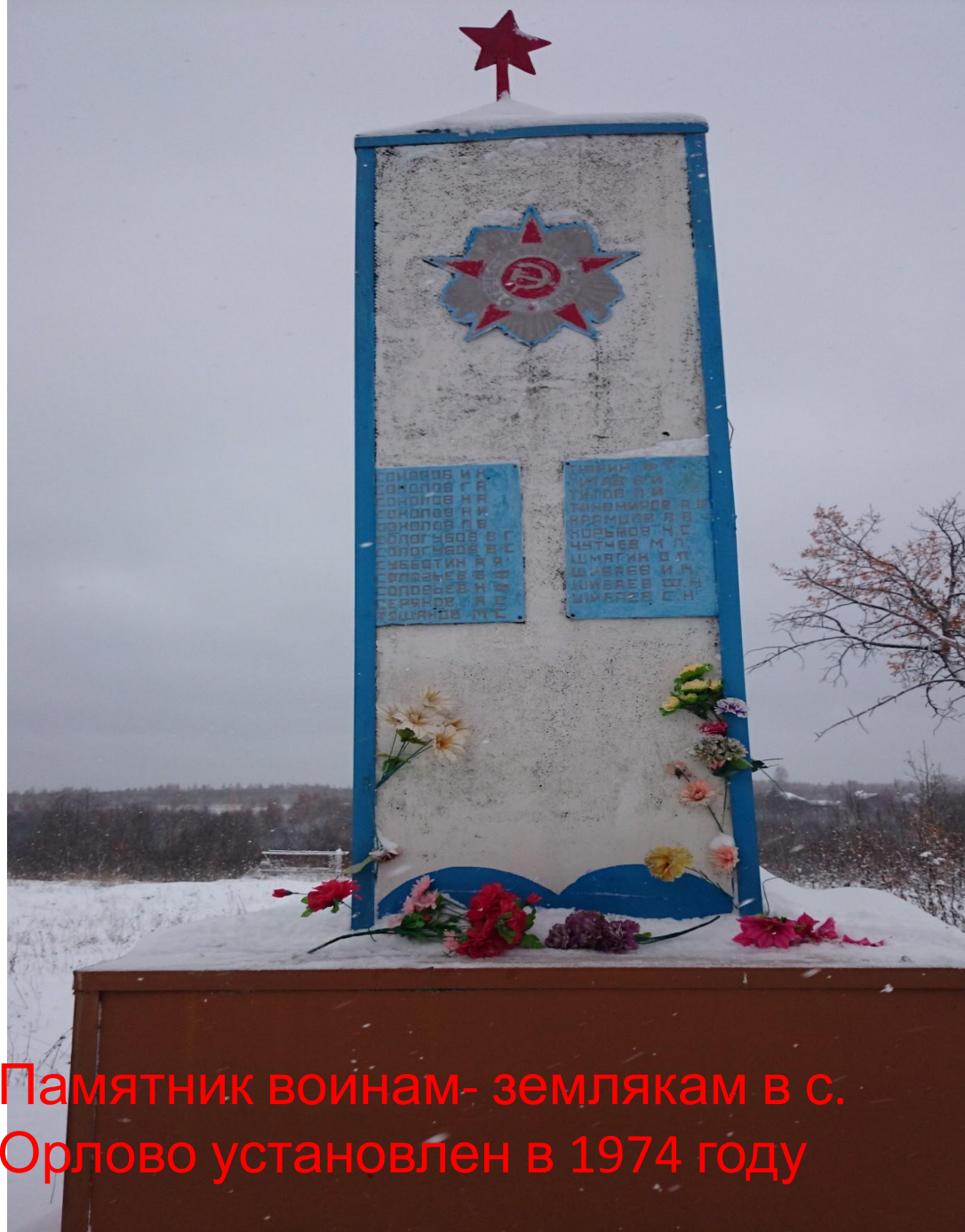
Памятник воинам- землякам в с. Орлово установлен в 1974 году