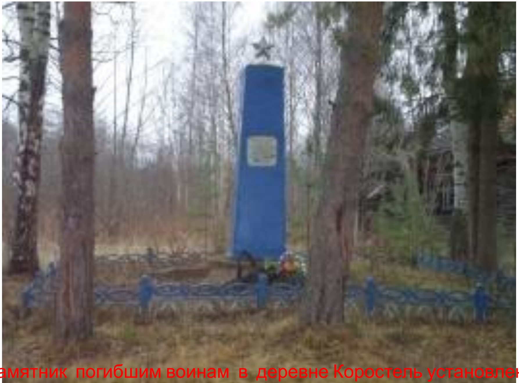
Памятник погибшим воинам в деревне Коростель установлен в