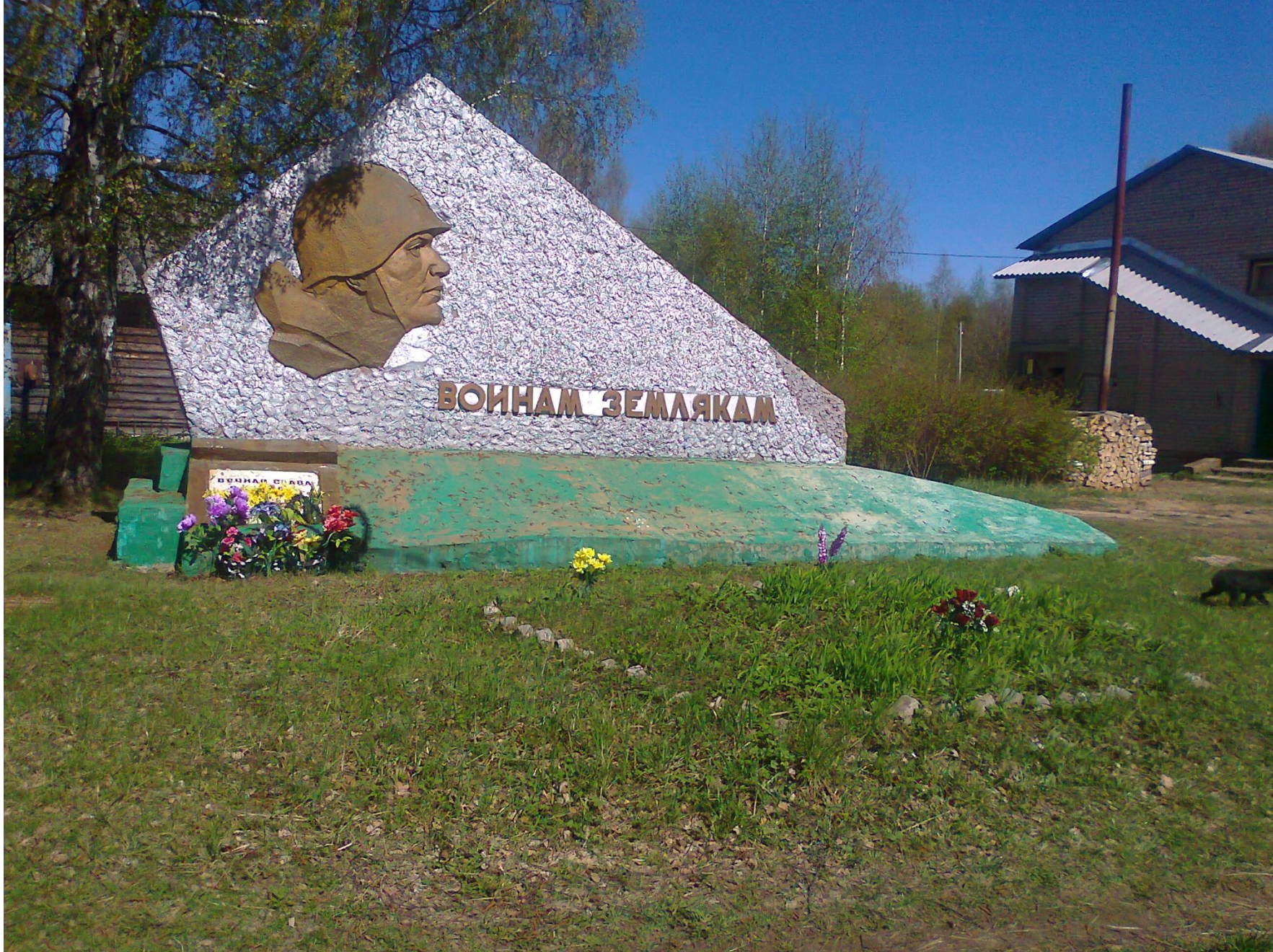
Памятник воинам землякам в деревне Остряковка установлен в 1973 году