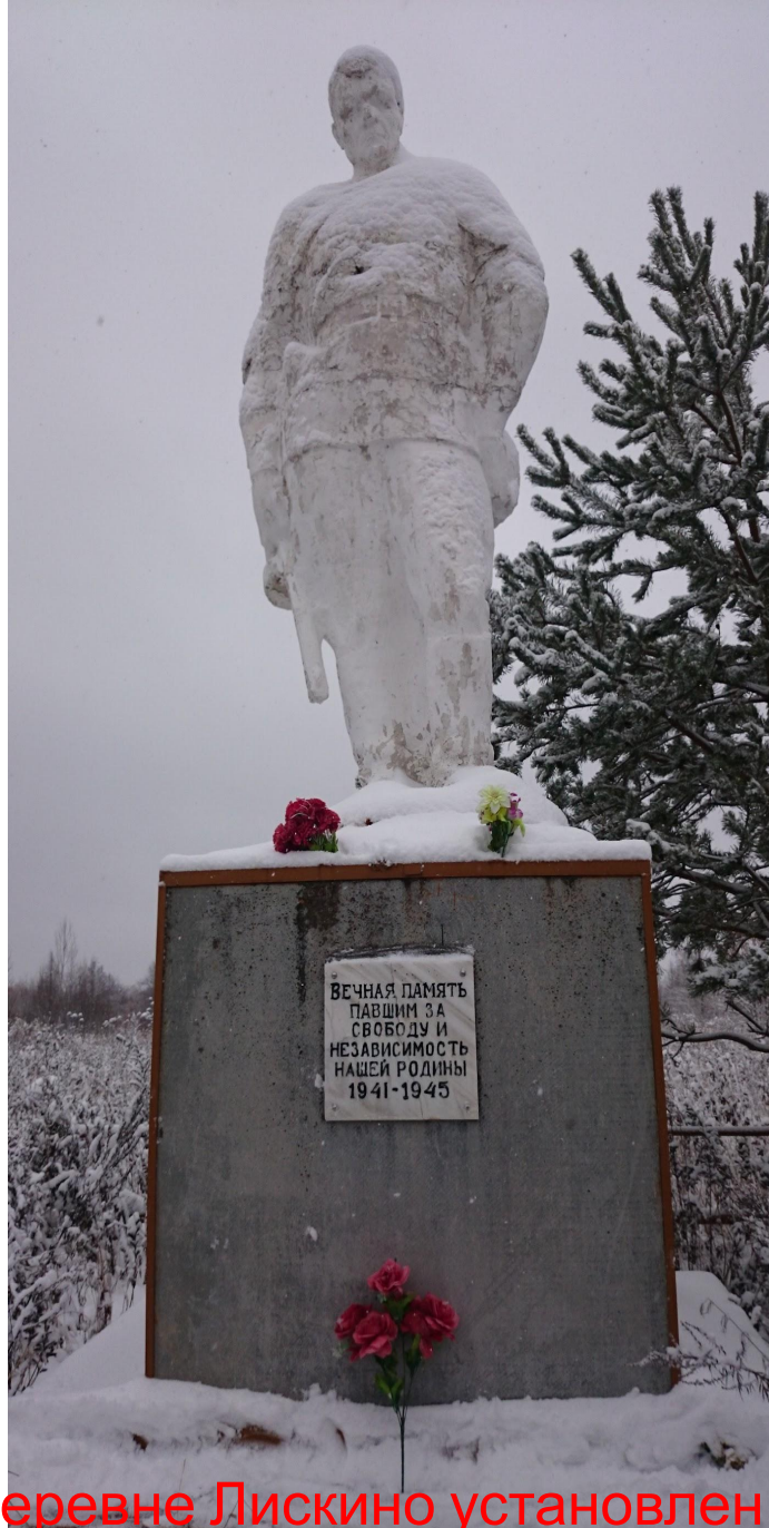
Памятник воинам в деревне Лискино установлен в 1973 году