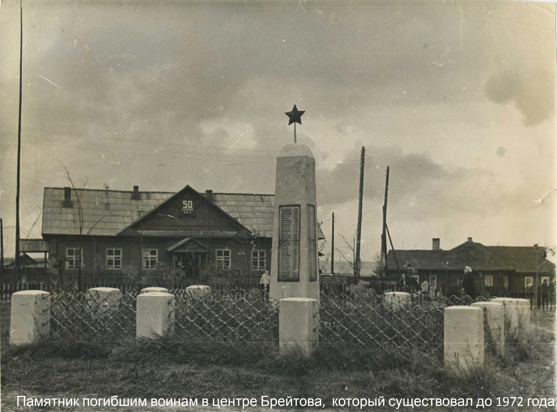
Памятник погибшим воинам в центре Брейтова, который существовал до 1972 года.