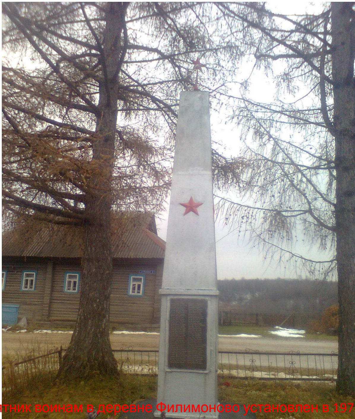
Памятник воинам в деревне Филимоново установлен в 1972 году