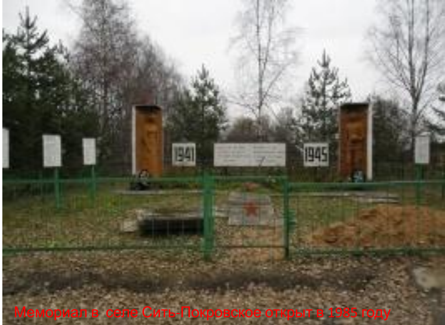
Мемориал в селе Сить-Покровское открыт в 1985 году