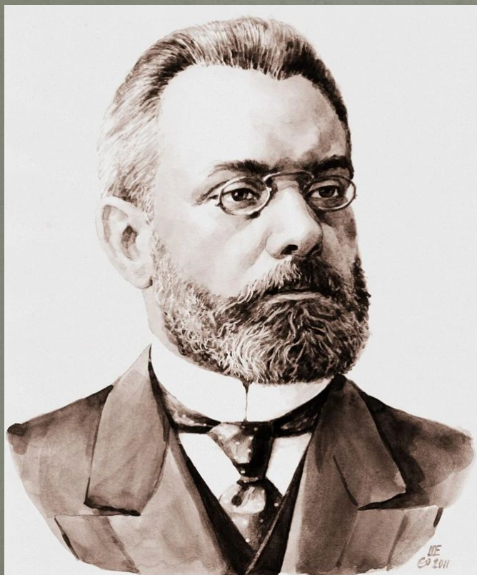
Александр Иванович Гучков