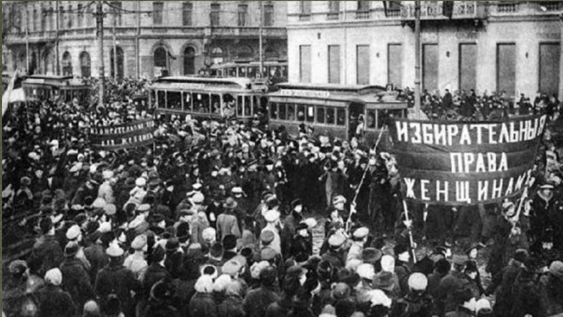
Восстание на Путиловском заводе. Февраль 1917