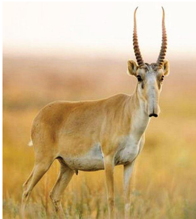
Жан - жануарлар