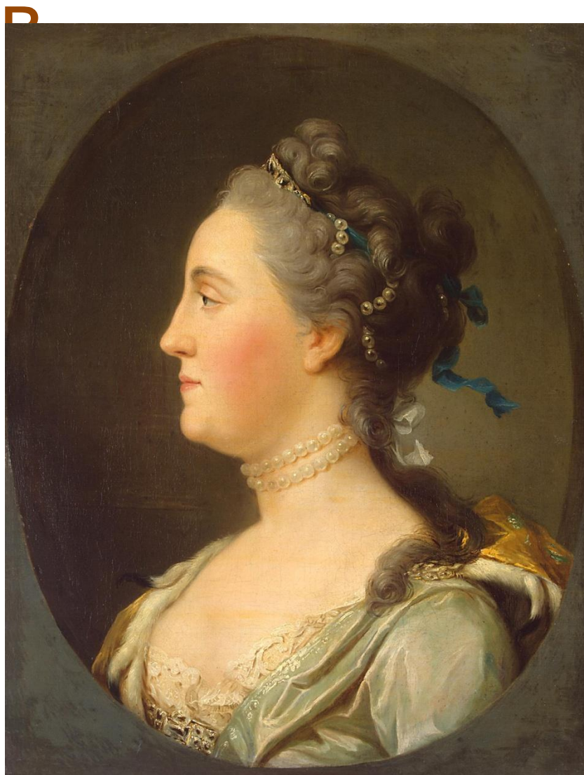
Портрет великой княгини Екатерины Алексеевны, Вигилиус Эриксен