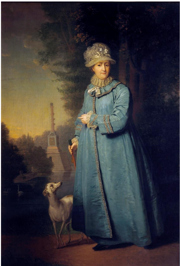
Екатерина II на прогулке в Царскосельском парке, В. Л.