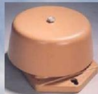
Звонки громкого боя и электросирены