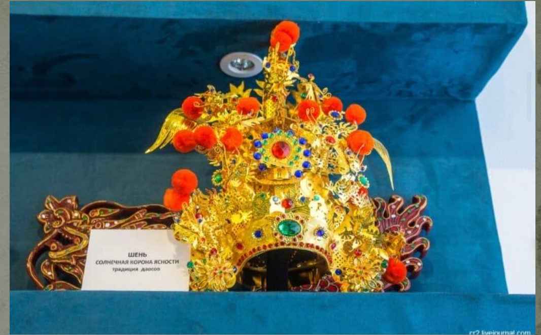
ШЕНЬ СОЛНЕЧНАЯ КОРОНА ЯСНОСТИ традиция дьяосов