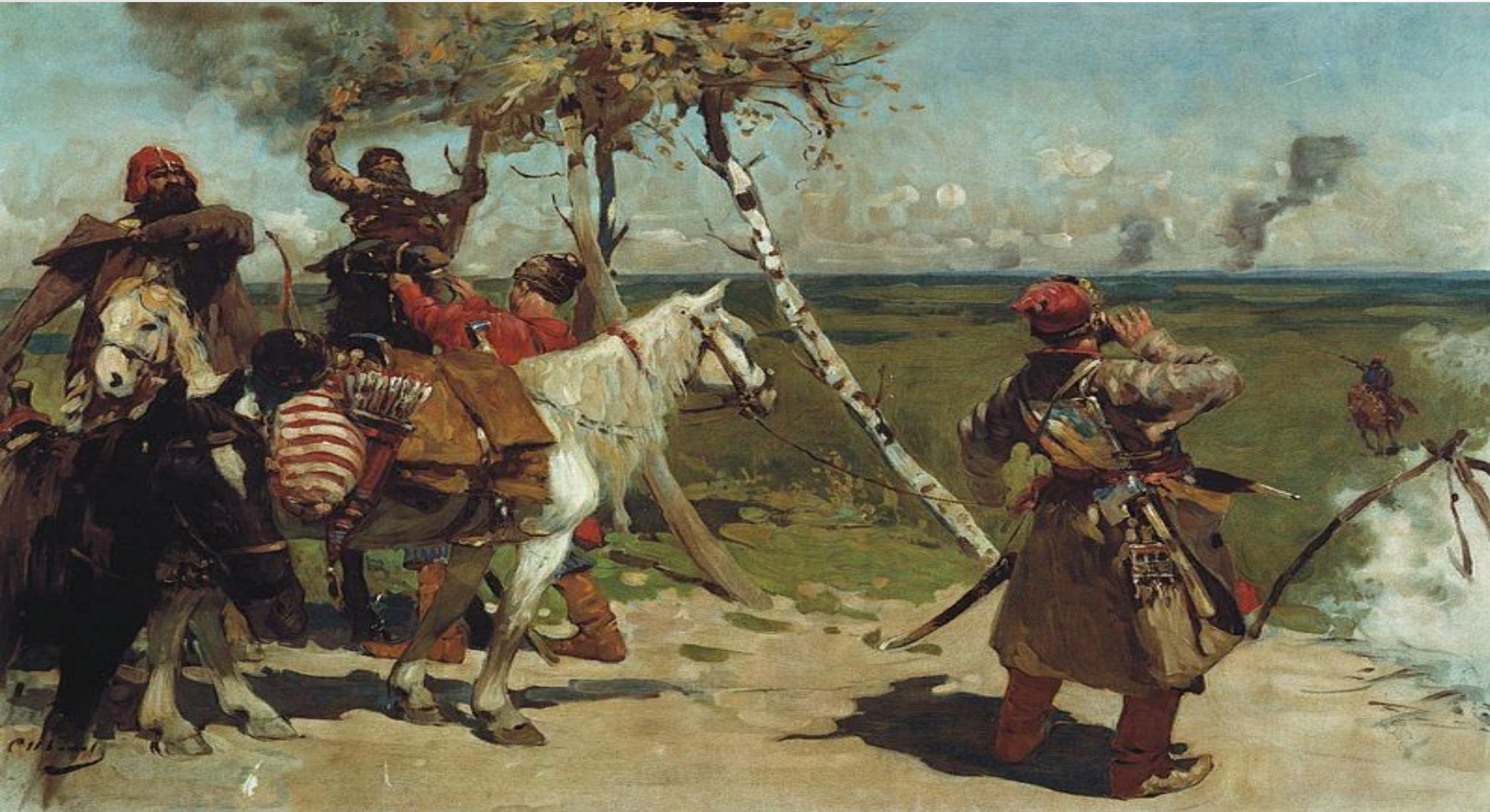
«На сторожевой границе Московского государства» (изд. И. Н. Кнебеля, 1907)