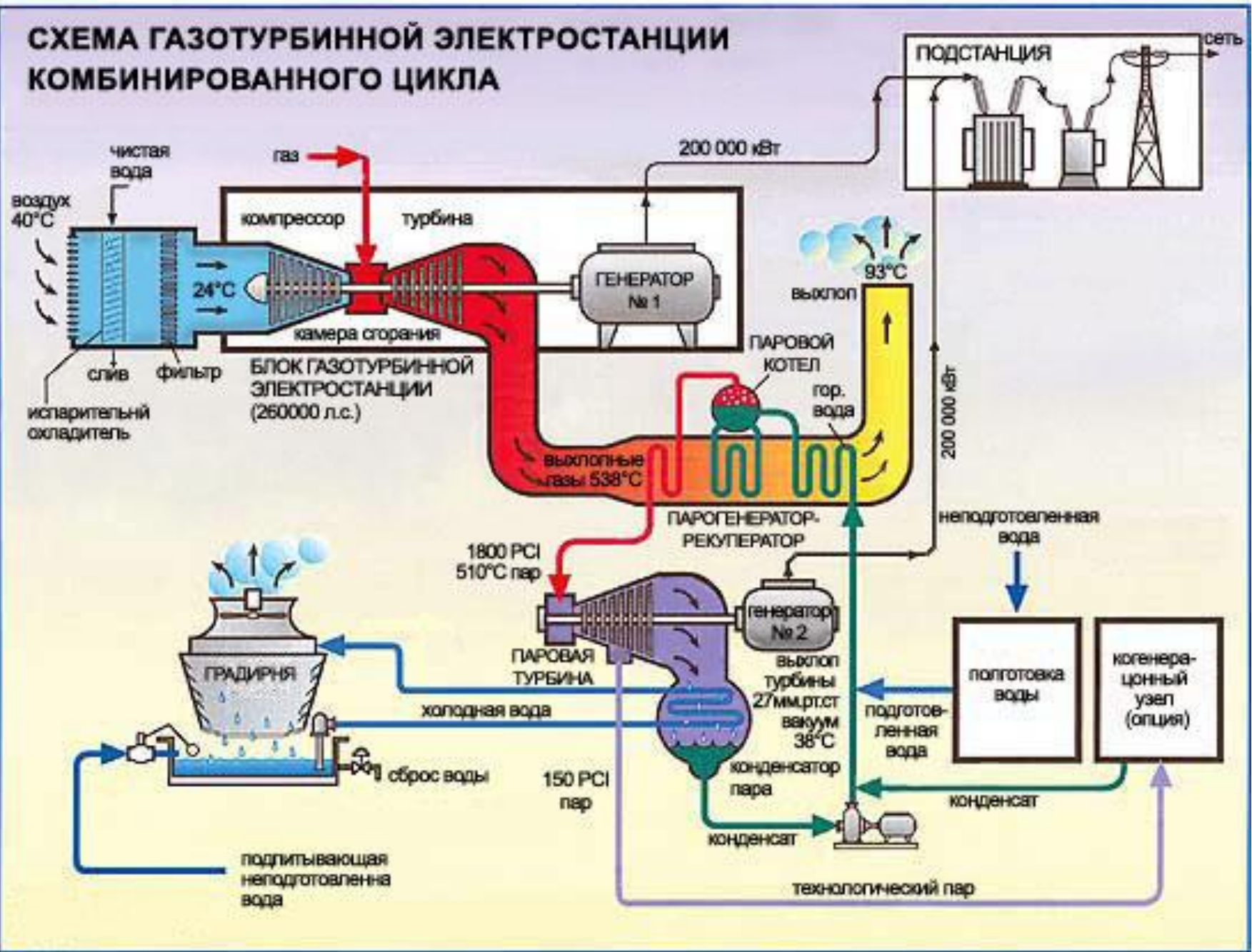
СХЕМА ГАЗОТУРБИННОЙ ЭЛЕКТРОСТАНЦИИ КОМБИНИРОВАННОГО ЦИКЛА