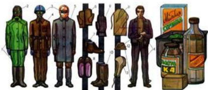
Ма.т. 204. Засоби захисту шкіри

3. Після того, яко пройде ударна хвиля, негайно надіти протигаз чи респіратор, чи хочаб якимось іншим чином захистити дихальні шляхи