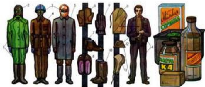
Ма.т. 204. Засоби захисту шкіри

3. Після того, яко пройде ударна хвиля, негайно надіти протигаз чи респіратор, чи хочаб якимось іншим чином захистити дихальні шляхи