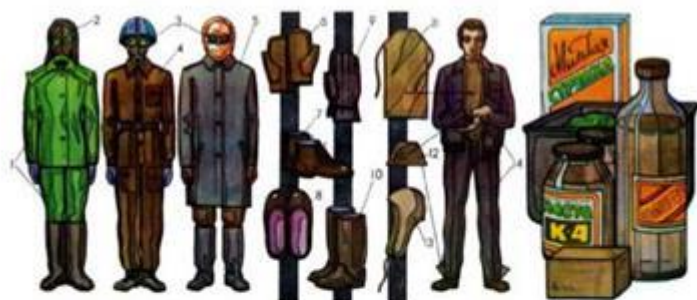
Ма.т. 204. Засоби захисту шкіри

3. Після того, яко пройде ударна хвиля, негайно надіти протигаз чи респіратор, чи хочаб якимось іншим чином захистити дихальні шляхи