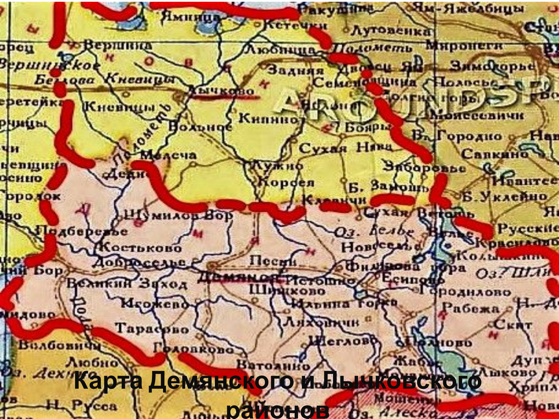
Карта Демянского и Лычковского районов