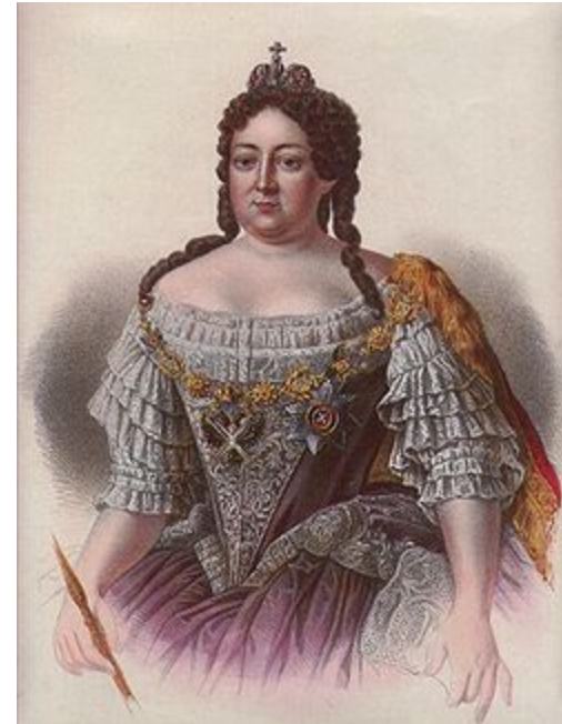
Анна Іванівна ( рос. Анна Иоанновна, 28 січня (7 лютого) 1693 - 17 жовтня (28 жовтня) 1740) - російська імператриця з 21 січня (5 лютого) 1730-1740 з династії Романових. Племінниця Петра I.