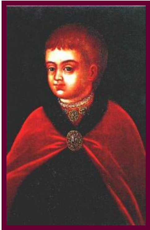
Петро I в дитинстві. Невідомий художник

В серпні 1689 після спроби вчинити державний переворот її було позбавлено влади і заслано в монастир. З цього часу Петро I і став фактично, а після смерті Івана V (1696) і юридично єдиначальним правителем, монархом.