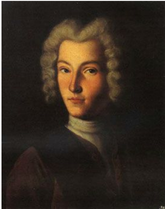
Петро II ( 1727 – 1730 рр.) – онук Петра I