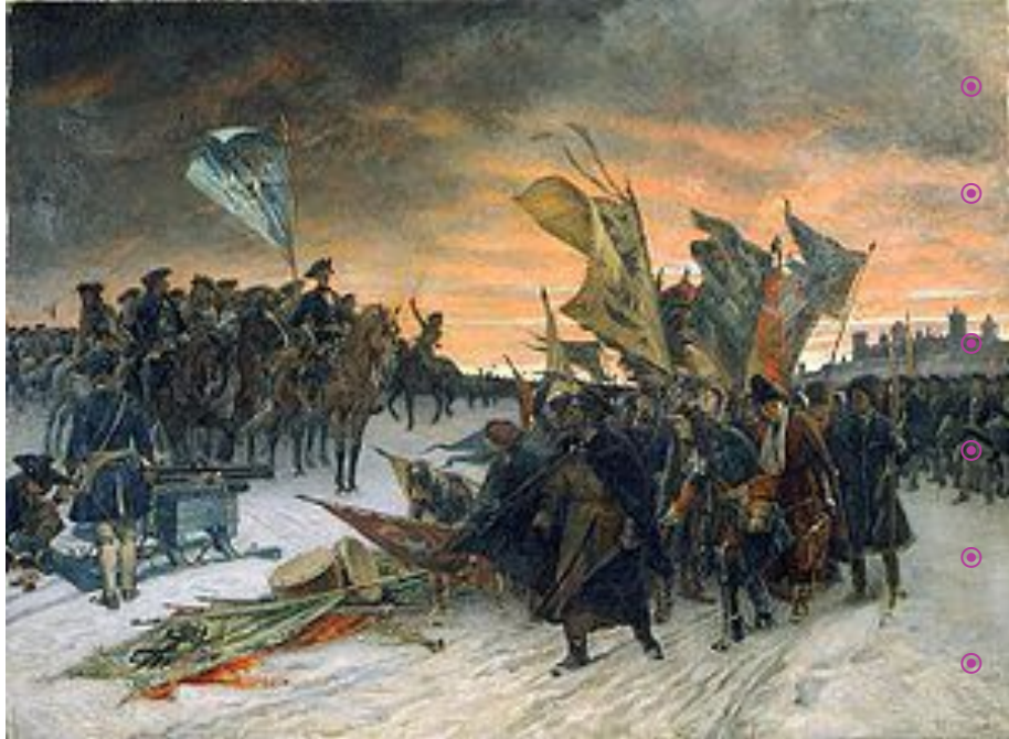
«Перемога шведів в битві при Нарві 1700». Густав Седерстрем 1910