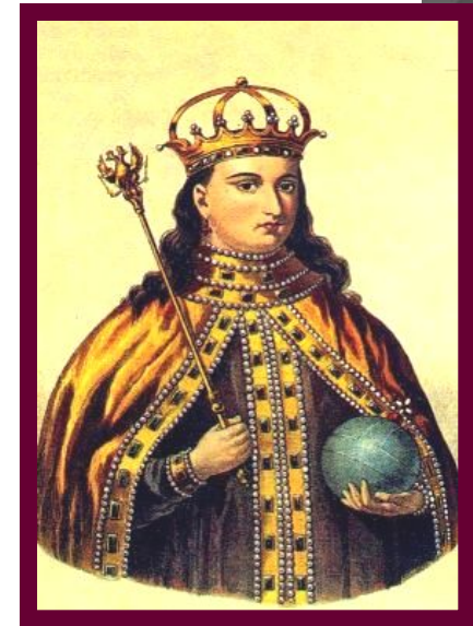
Царівна Софія Олексіївна