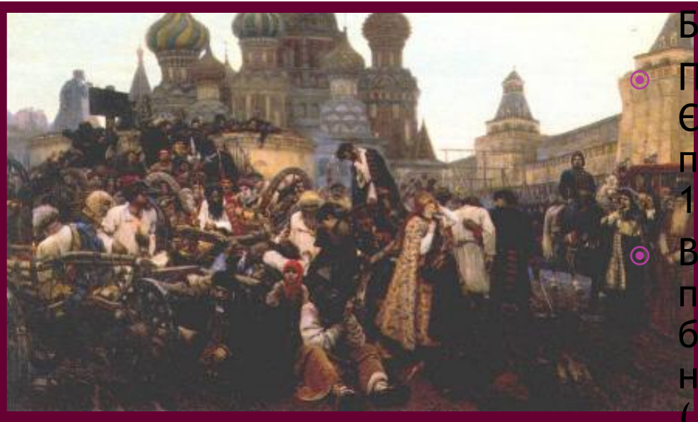
В.Суриков. Утро стрелецкой казни