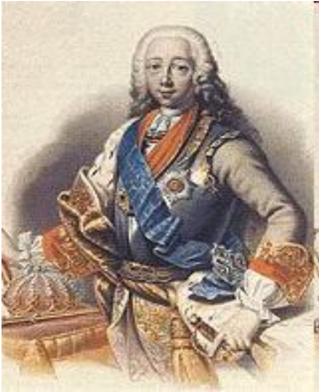
Петро III Федорович — імператор Росії (1761—1762 рр.).