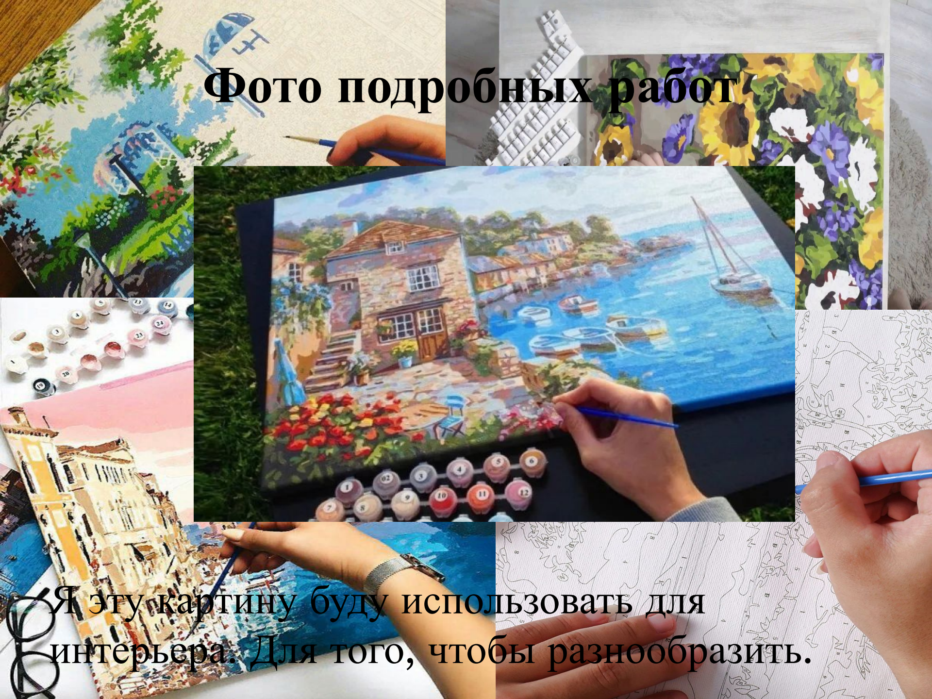
Фото подробных работ

Я эту картину буду использовать для интерьера. Для того, чтобы разнообразить.