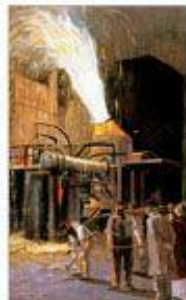
Сталелитейный завод в Англии