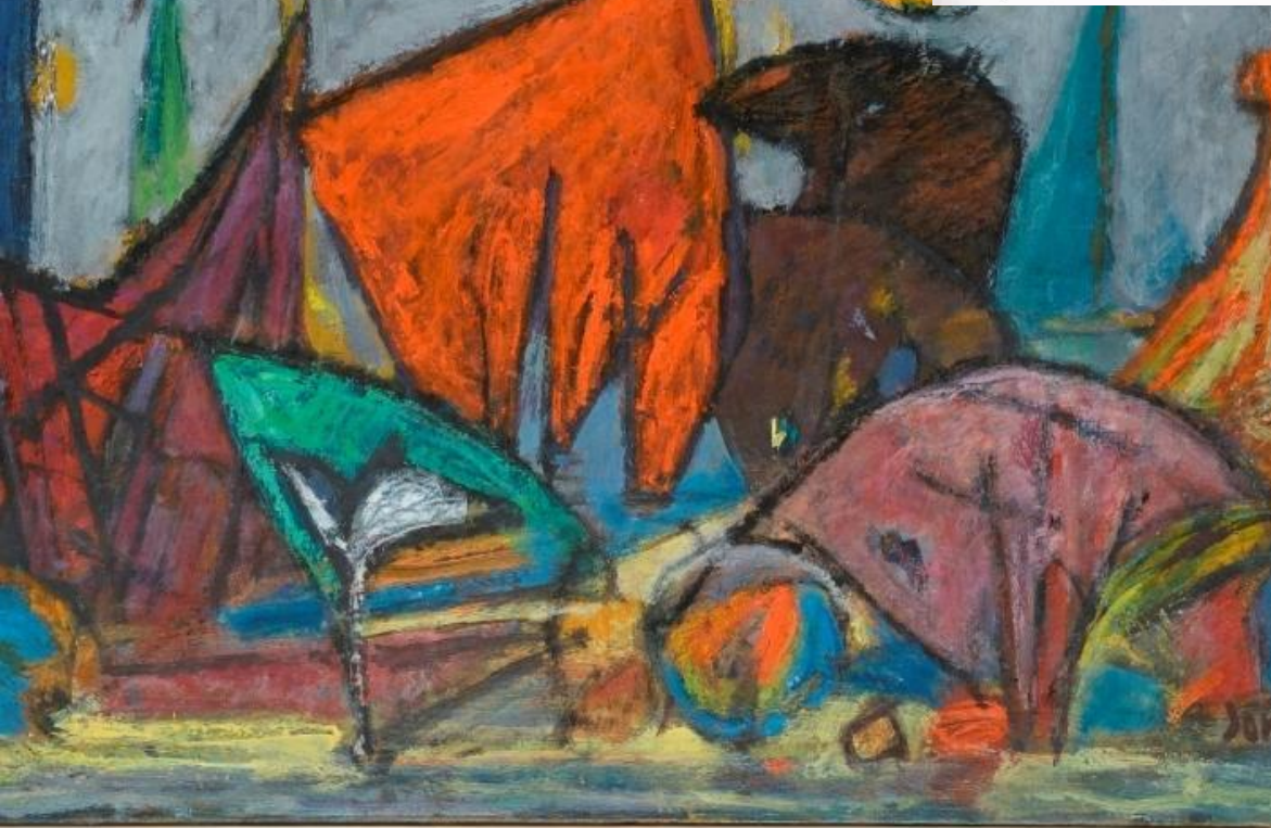
Марсель Янко «Фантастические животные»