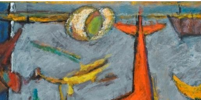
Марсель Дюшан «Девятая форма злобы»