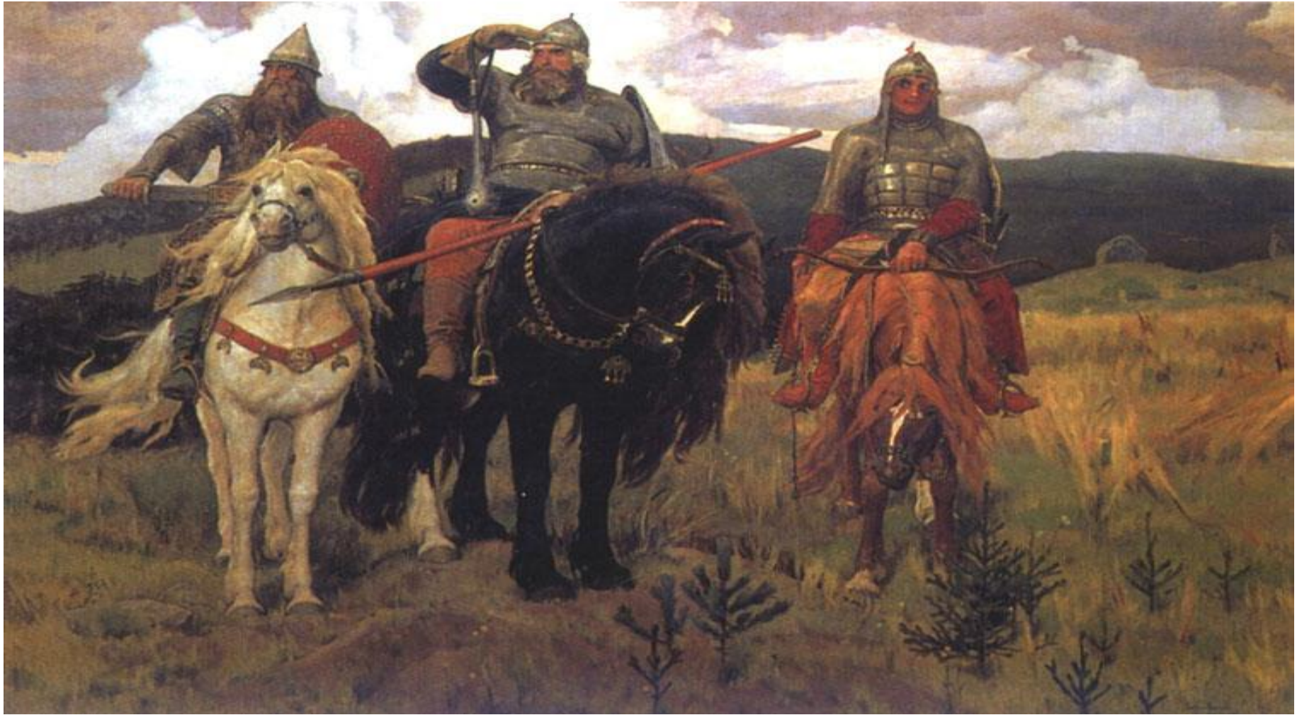
Виктор Михайлович Васнецов «Богатыри»