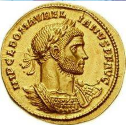
Ауреус с портретом Аврелиана