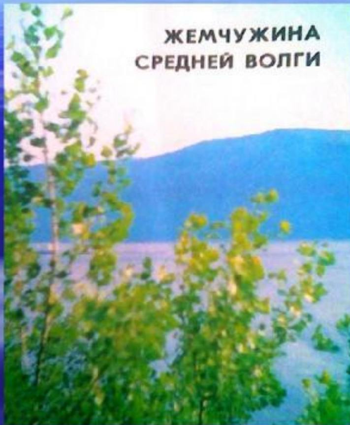
ЖЕМЧУЖИНА СРЕДНЕЙ ВОЛГИ