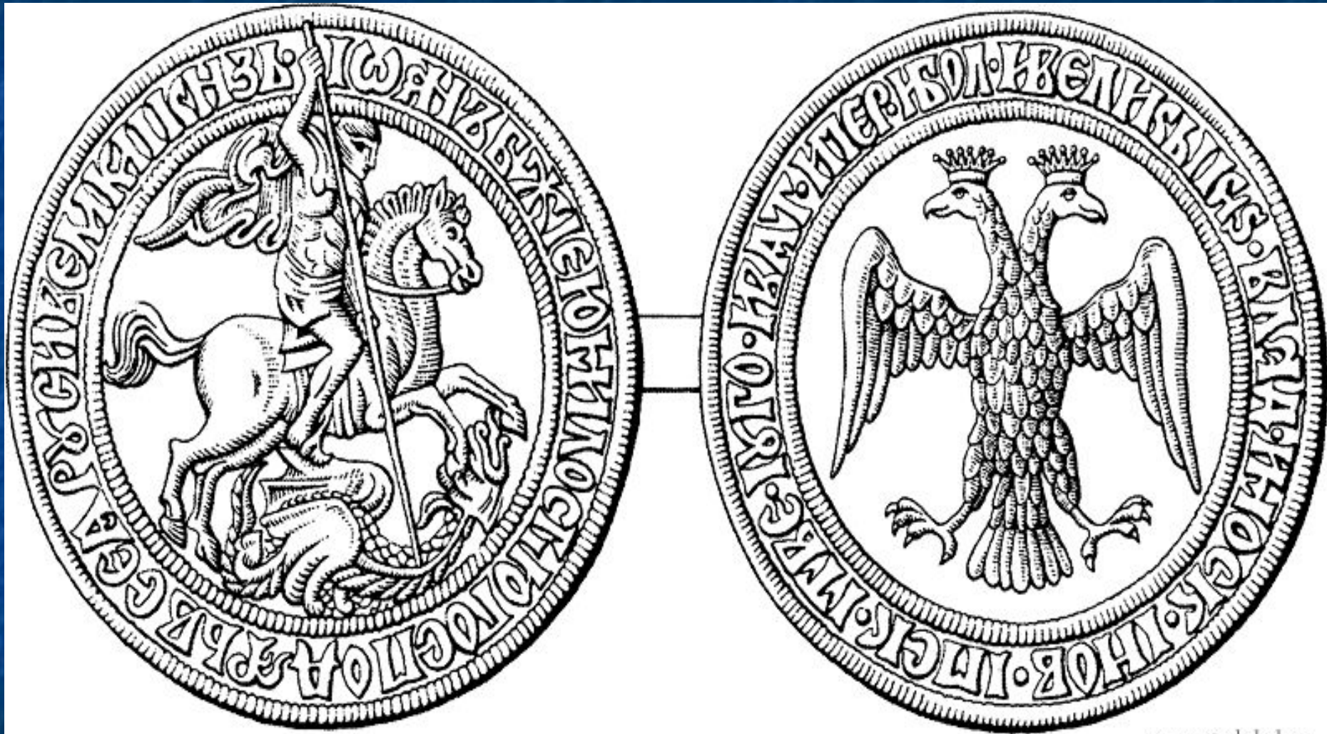
Печать Ивана III Васильевича. Конец XV в. Прорись А.Г. Силаева.