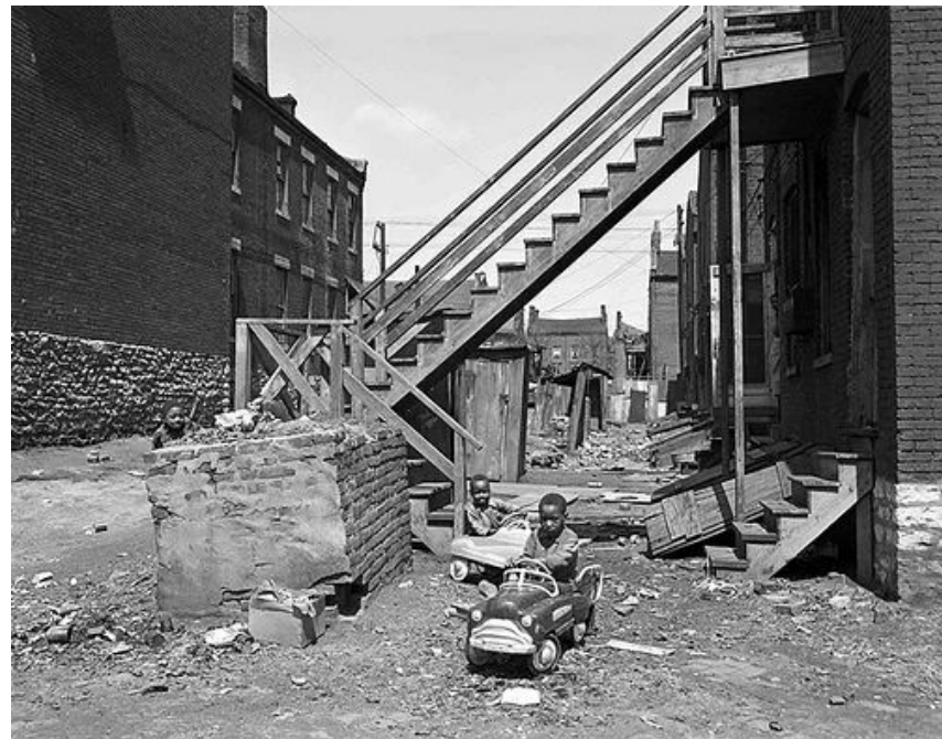
Середина 1960-х - гетто