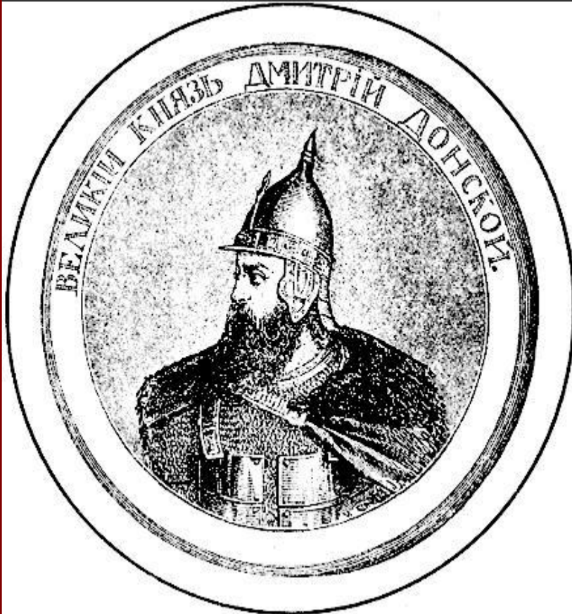
Великий князь Дмитрий. Гравюра XIX в.

В 1375 г. Дмитрий подошел к Твери и тверской князь признал себя «Молодшим братом».