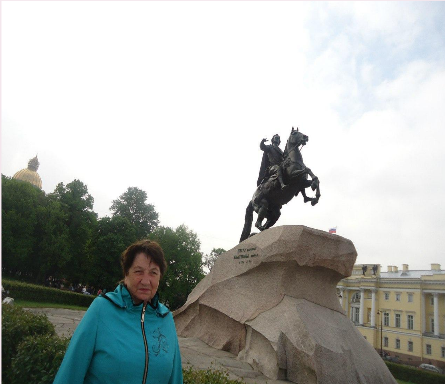
Памятник Петру Первому на дворцовой площади, г. Санкт Петербург