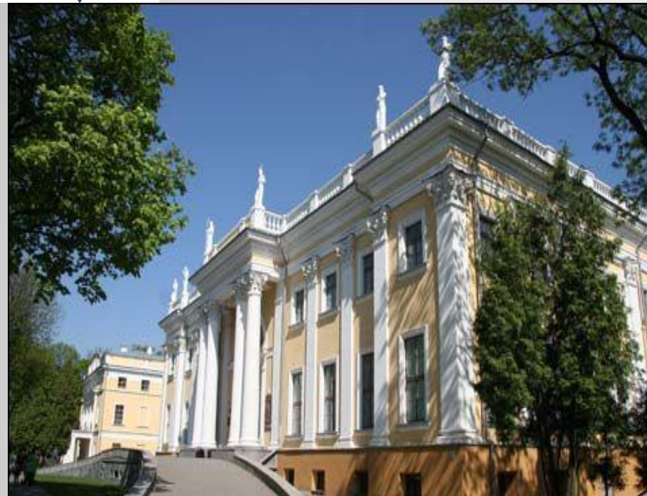
Дворцово-парковый ансамбль Румянцевых-Паскевичей