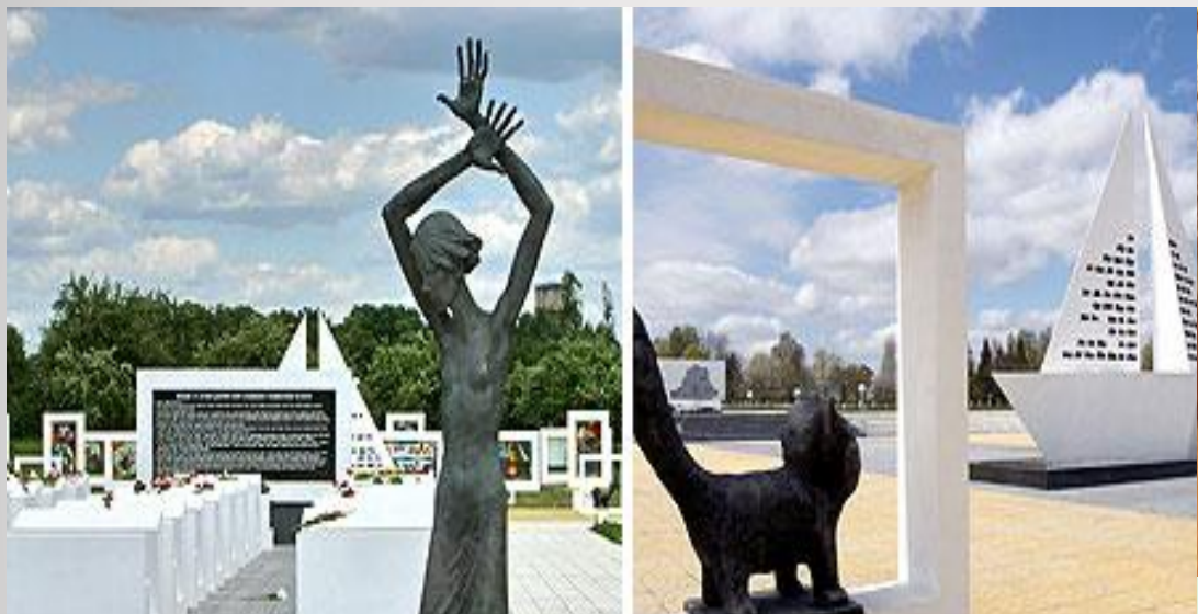
Мемориальный комплекс «Детям – жертвам войны» (Красный Берег Жлобинского района)