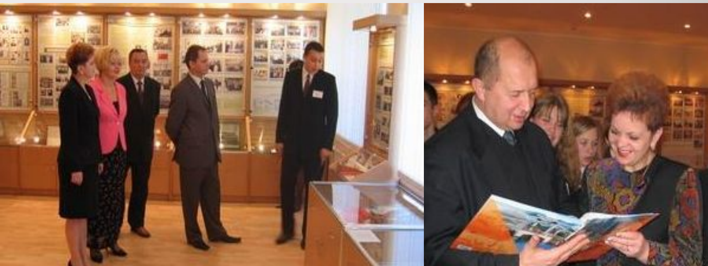
Открытие музея истории образования Гомельщины

Возведение мемориального комплекса «Детям – жертвам войны» в деревне Красный Берег Жлобинского района, а также историко-культурного комплекса в деревне Юровичи Калинковичского района. Открылись музеи редкой книги и музей истории образования Гомельщины.