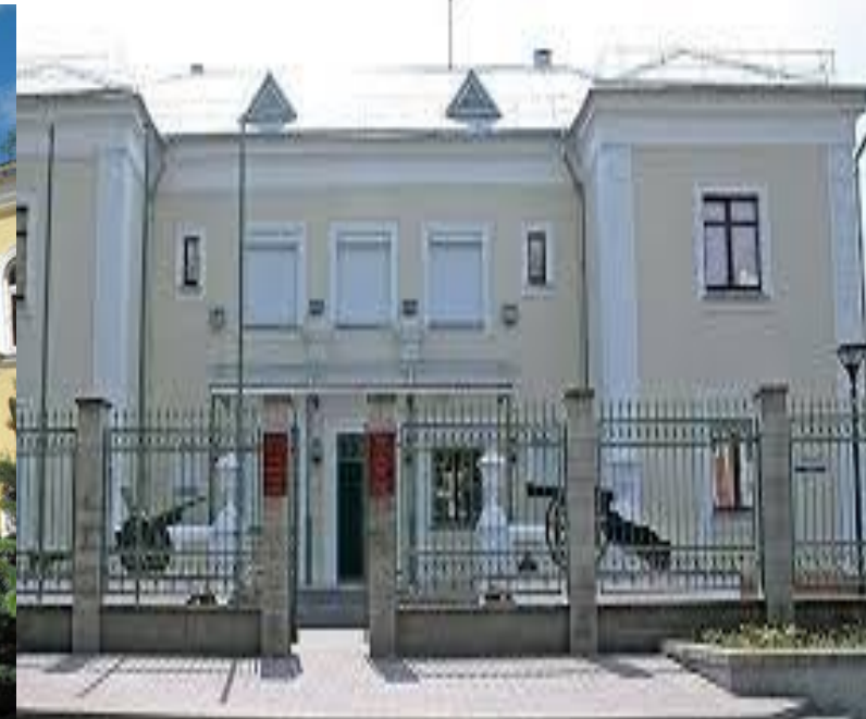
Музей военной славы

С 1997 по 2010 гг. в Гомеле благоустраивались знаменитый дворцово-парковый ансамбль Румянцевых-Паскевичей, создавался Музей военной славы, открывалась картинная галерея Гавриила Ващенко.