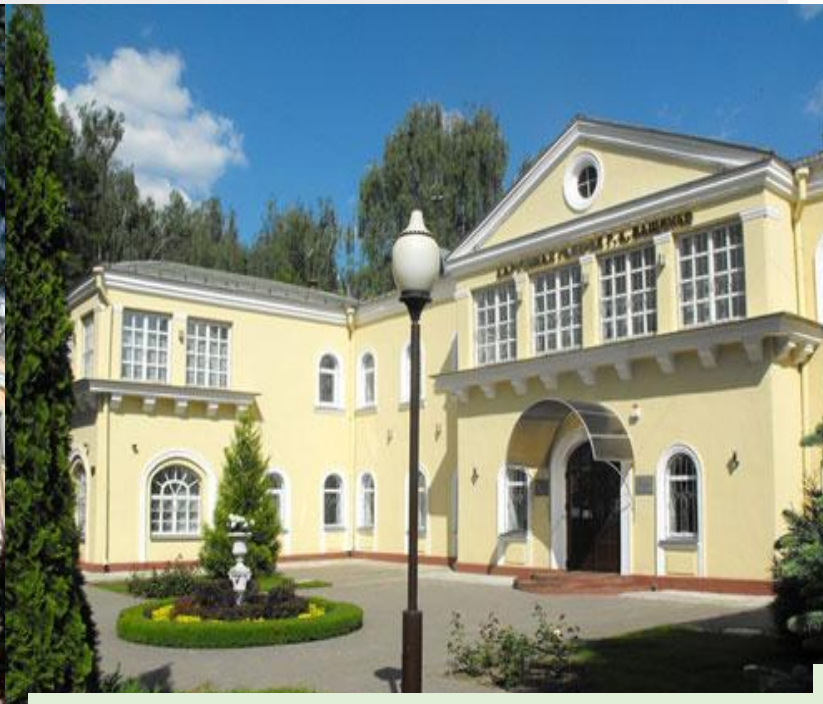
Картинная галерея имени Г.Х. Ващенко