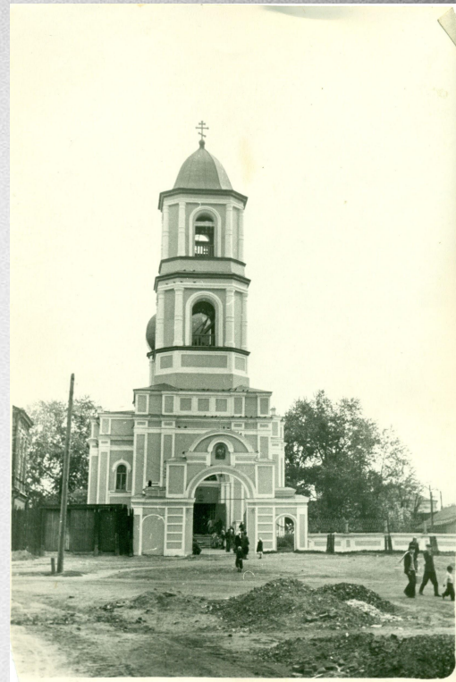
Свято-Троицкий кафедральный собор г.Перми