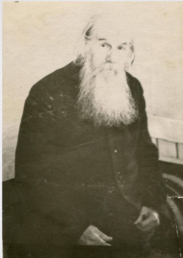
Протоиерей Борис Попов 1966 г.