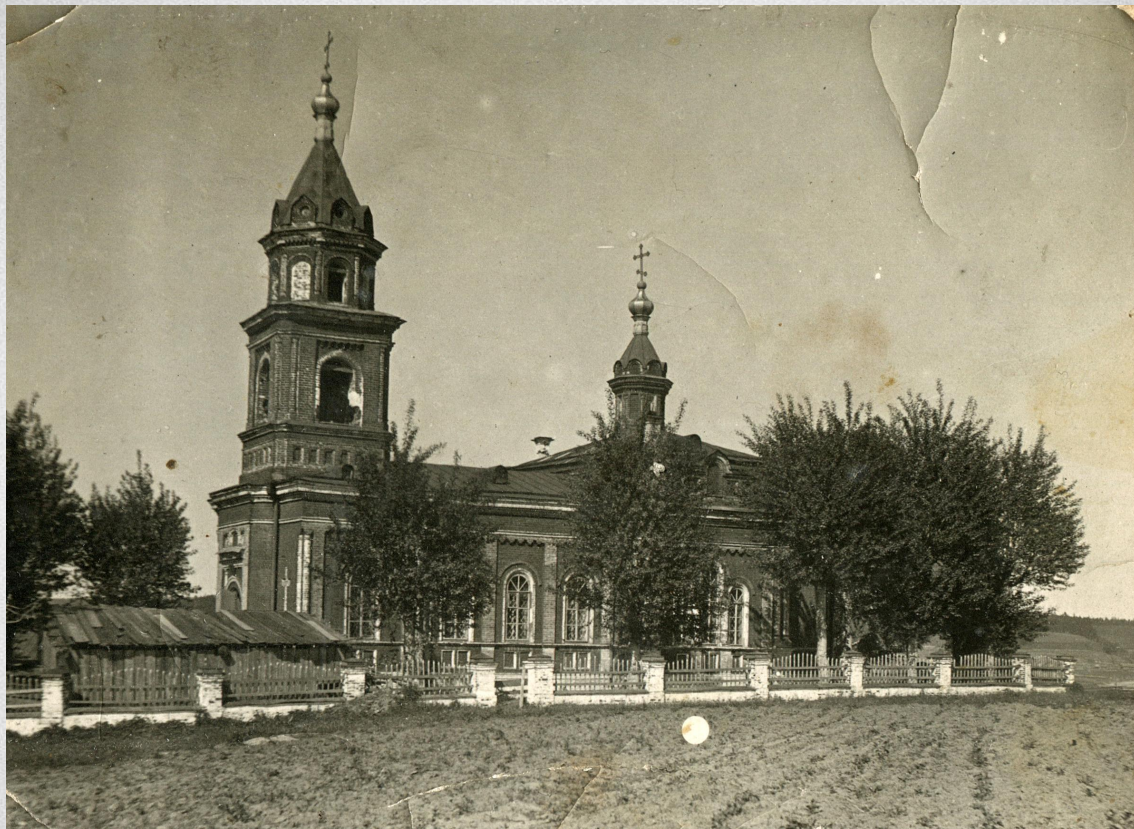
Сретенская церковь с.Усть-Сылва