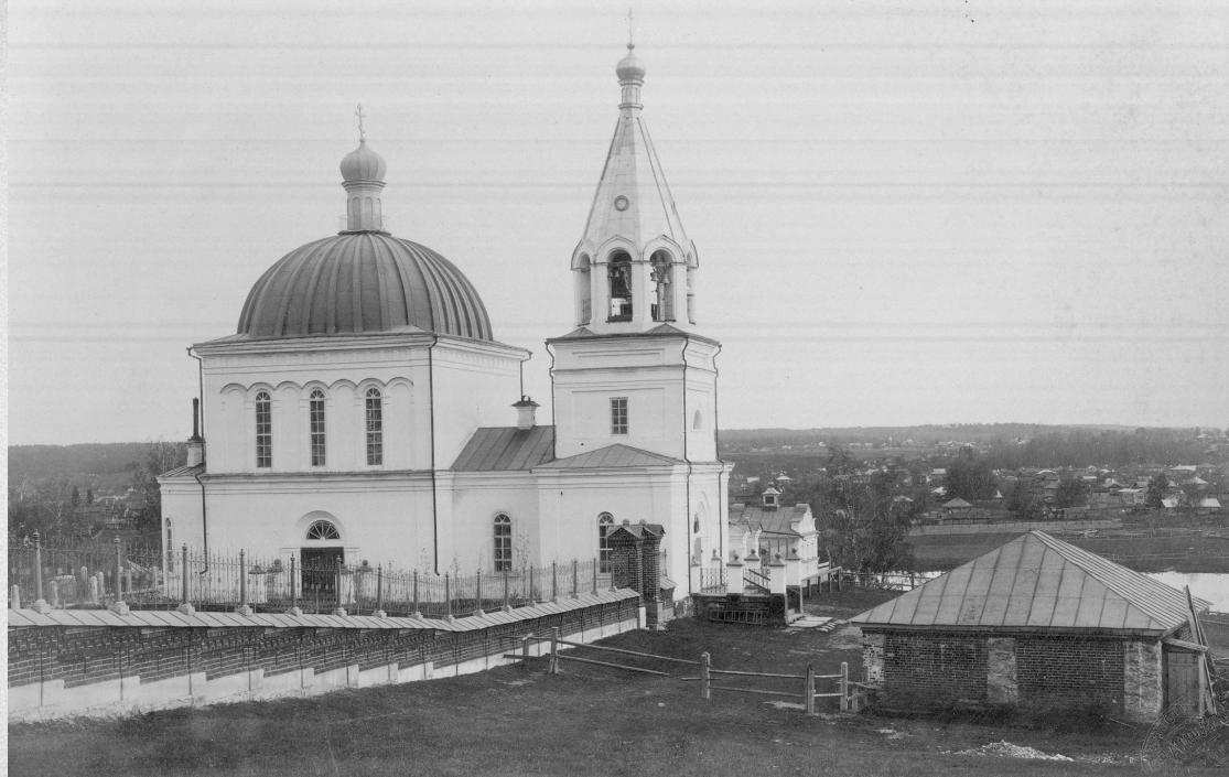
Всехвятская церковь в г. Кунгуре