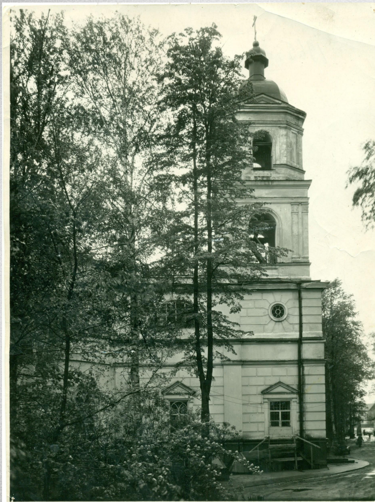
Всехсвятская церковь в г.Перми