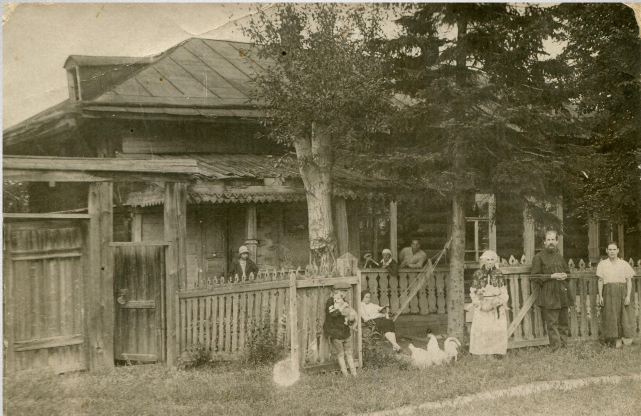
Отец Борис Попов у дома в с.Ляды 1920-е гг.