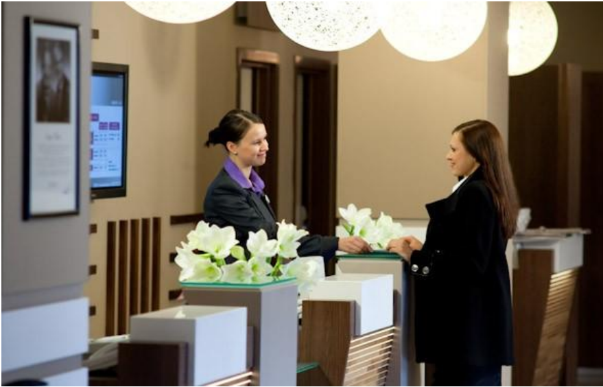
СХЕМА № 4