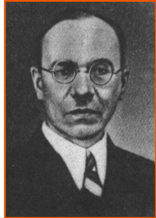
М. Н. Тихомиров

М.Н. Тихомиров: «Нет никакого сомнения, что Киевская Русь была уже знакома с концентрацией ремесленников в определенных городских кварталах», «Эта концентрация была предпосылкой к созданию ремесленных объединений».