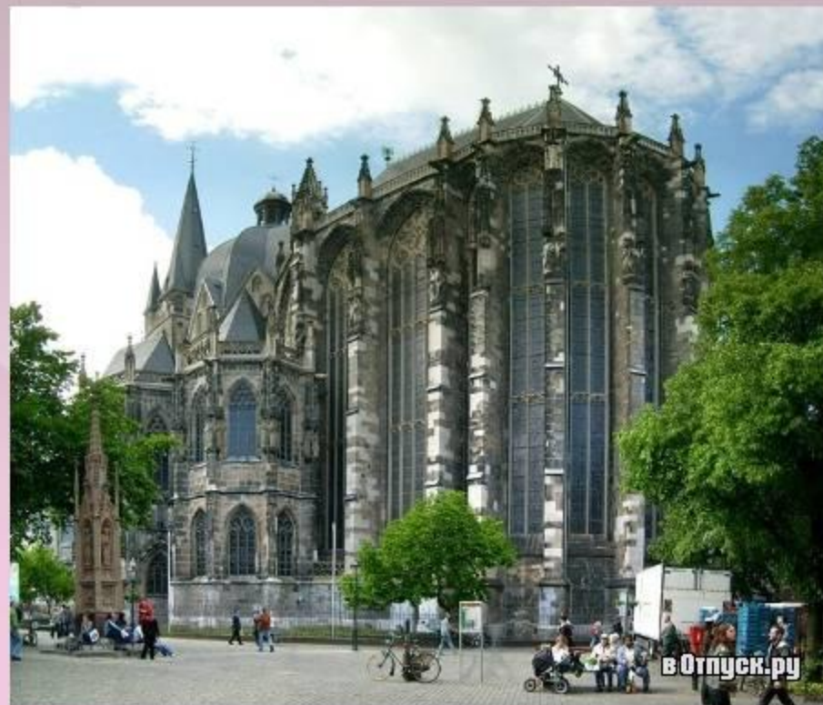
Аахенский кафедральный собор