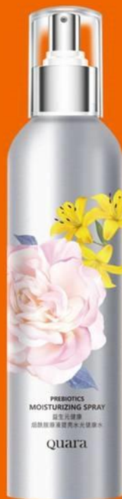
Никотинамидный спрей на пребиотиках