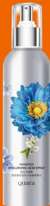
Гиалуроновый спрей на пребиотиках