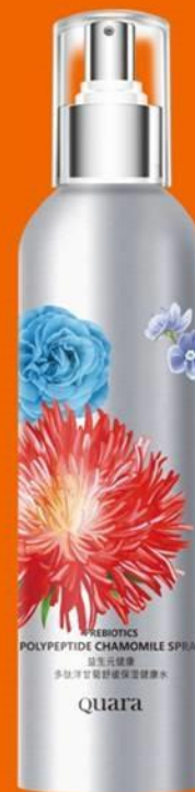
Спрей на пребиотиках с пептидами ромашки