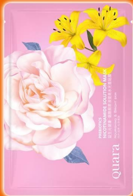
Никотинамидная маска на пребиотиках