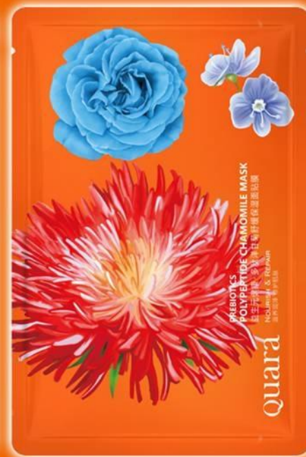
Маска на пребиотиках с ромашкой