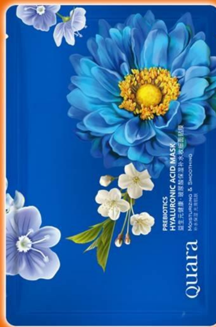
Гиалуроновая маска на пребиотиках